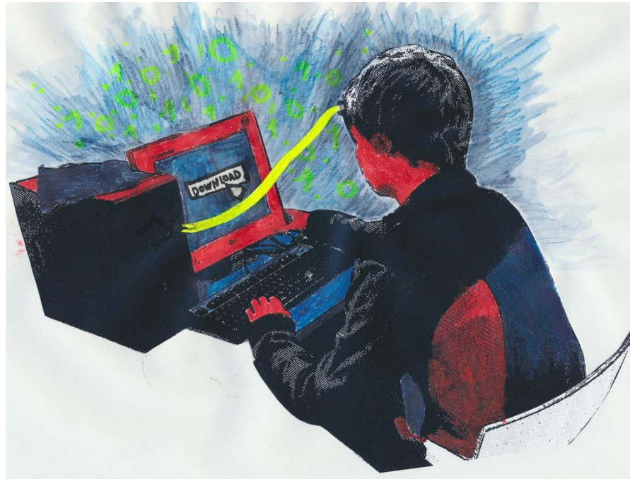
Raahen lukion opiskelijat, 2014