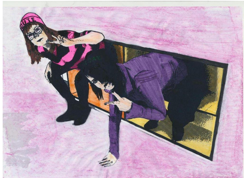
Raahen lukion opiskelijat, 2014