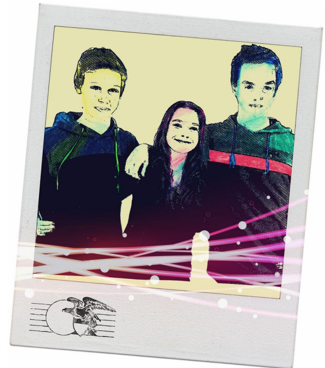
Raahen lukion opiskelijat, 2014