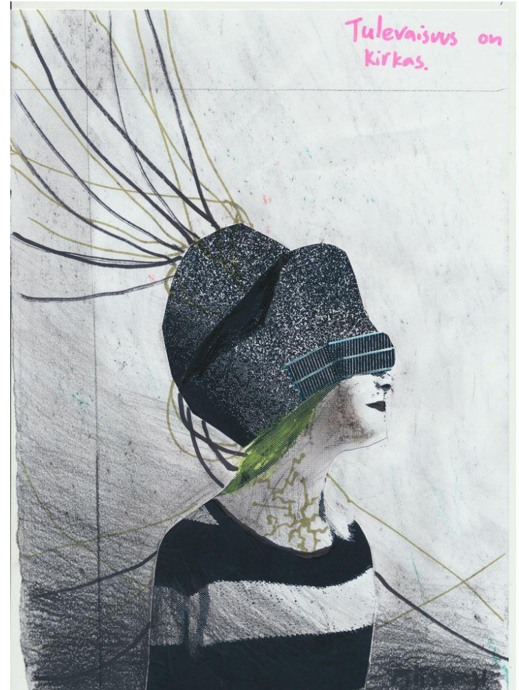
Raahen lukion opiskelijat, 2014