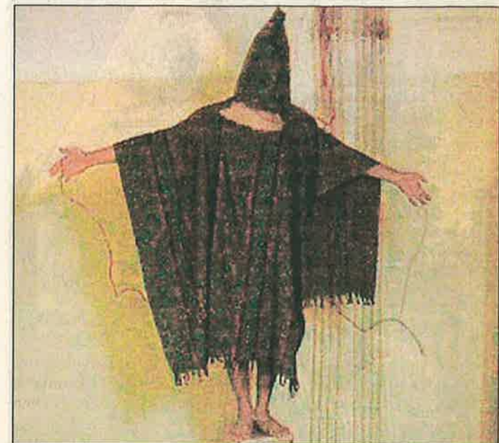
THE NEW YORKER

Kiinnostavaa on myös, että vain yksi ihminen oli kyseenalaistanut tutkimuksen tätä ennen – hänkin nainen, ahdistuneen vankikoehenkilön äiti.