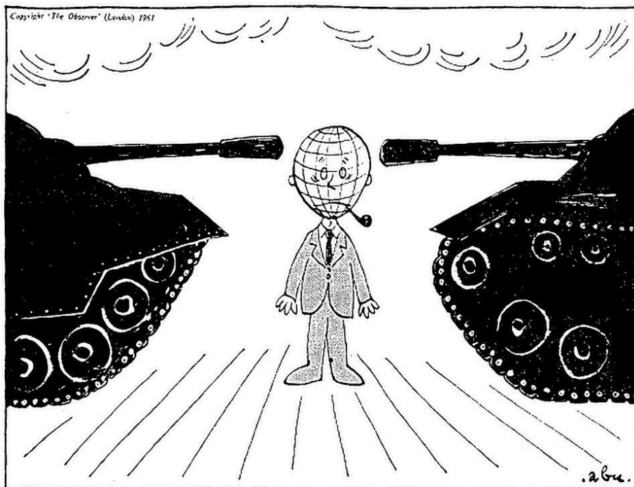
Balance of terror