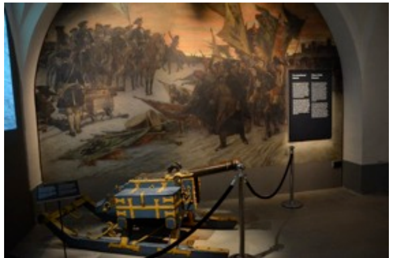
Lyödyt venäläiset laskevat sotalippuja Ruotsin kuningas Kaarle XII jalkojen juureen Narvassa 20.11.1700.