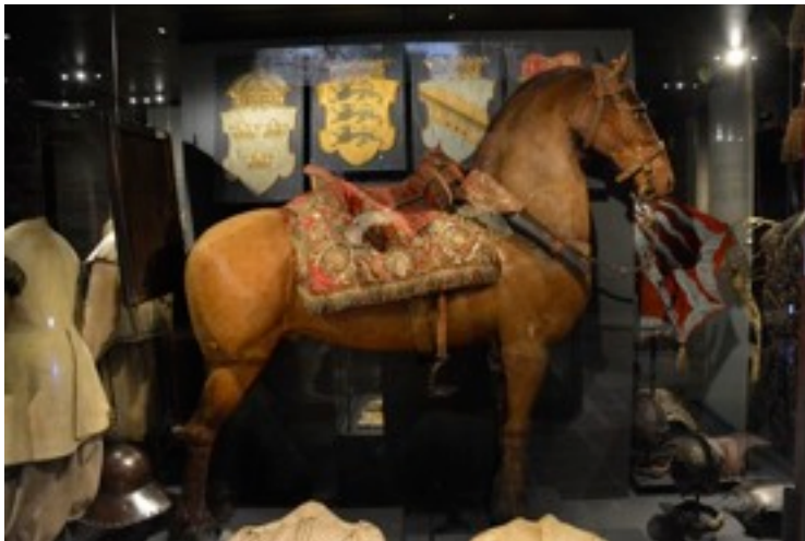
Kustaa II Aadolfin Streiff-hevonen on täytettynä Livrustkammaren-museossa. Kustaasta alettiin tehdä pyhimystä jo hänen elinaikanaan.