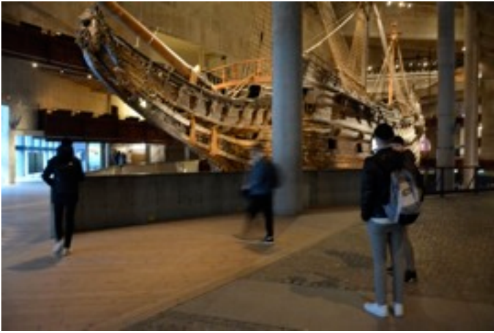
Entisöity Vasa-laiva on vaikuttava näky.