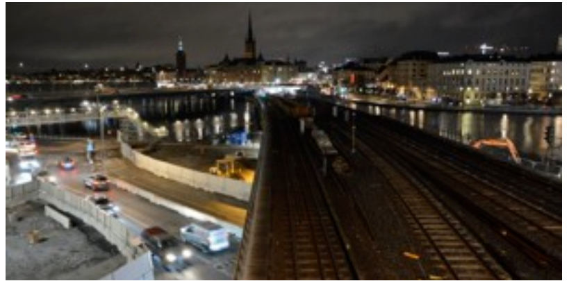
Vanhoissa, osittain puretuissa Slussenin rakenteissa näkyy rapistumisen merkkejä.

aikoihin, kun virallisesti ilmoitettiin viruksesta. Se siis ehti Tukholmaan ennen siltaa.