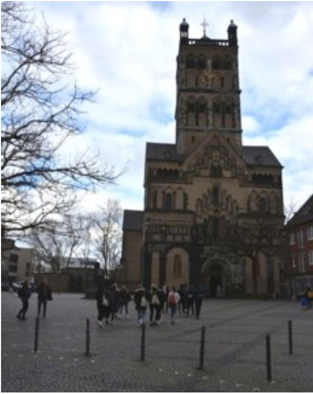
Quirinus-Münster church in Neuss.