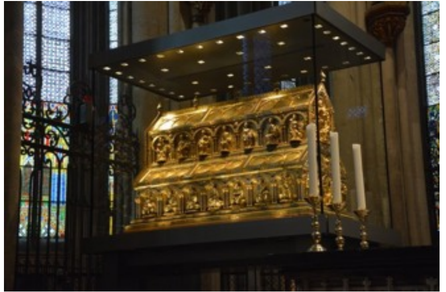
The Reliquary of Three Kings in the Cathedral.