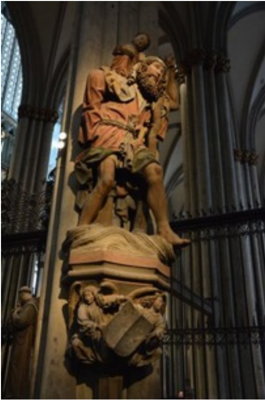
Saint Christopher carrying the Christ Child in the Cathedral of Cologne.