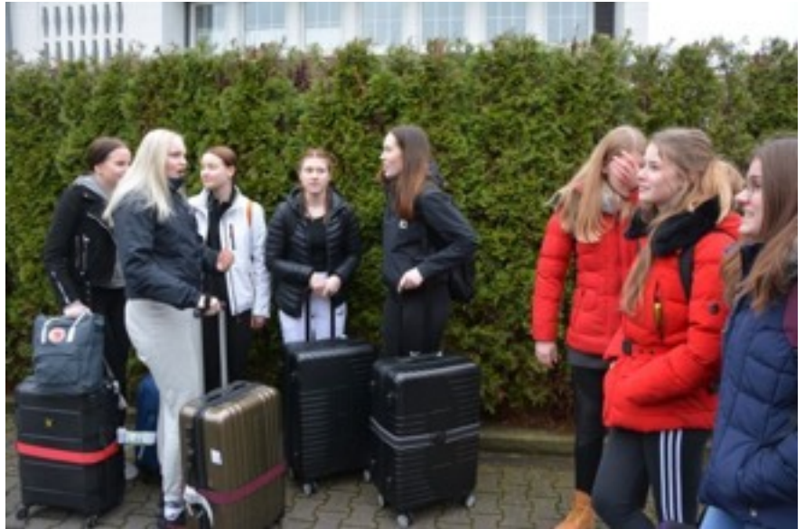
We met our German partners at Nievenheim railway station.

There is a private exchange program between Berthan-von-Suttner comprehensive school of Dormagen, Germany and our school. We visited the German school from March 6th thru 13th. We were expecting them to visit us in October. Because of the Corona Virus pandemic their reciprocal visit has rescheduled to February-March, 2021.