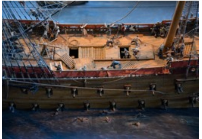
Pienoismalli esittää hetken, kun laiva alkoi upota.