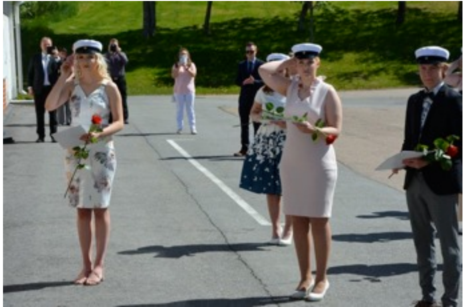
Principal of the high school promoted students for high school graduates.