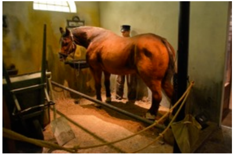
Tallissa on hauska yksityiskohta: hevonen potkaisee ämpäriä, kun vieras tulee sisään ovesta.