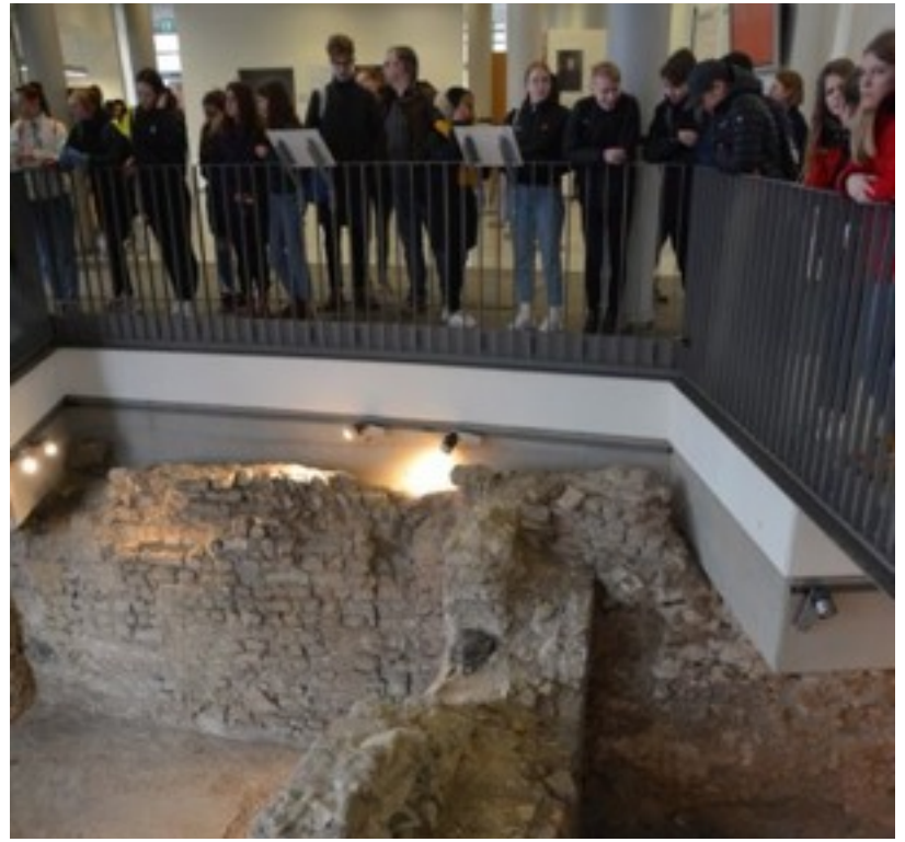
There has been a Roman military camp from 16 A.C.

On Sunday we went to the Neanderthal museum. Before the museum we walked in a park and saw some animals like horses and cattle. I liked the museum. It told about the history of man. After it we went to an Italian restaurant. The food was excellent. Then we went skating to a skating hall. I met there few of my partner's friends. Skating was fun and I enjoyed the music as well.