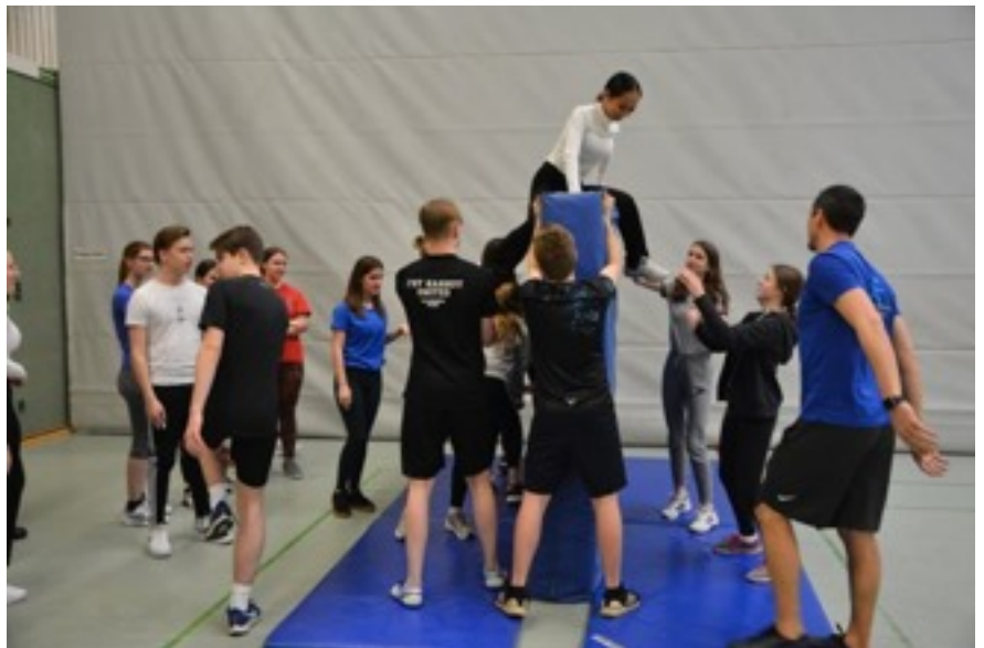
Welcome event included games which needed work in teams.