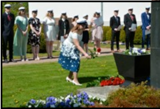
After the party graduates went to salute the Memorial of WWII Fallen Warriors.