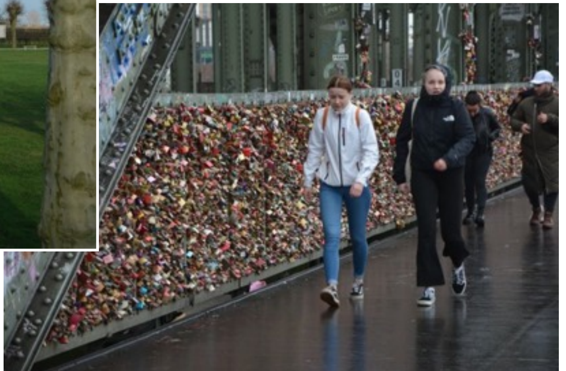
The railroad bridge in Cologne is covered with love locks.