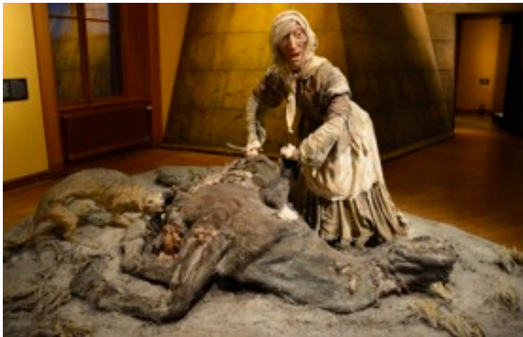
30-vuotisen sodan kauheuksia: nainen ja koira tappelevat mädäntyneestä hevosenraadosta.

Armeijamuseon erikoisuus on Raoul Wallenbergin huone. Wallenberg pelasti tuhansia juutalaisia vankeja saksalaisilta leireiltä sota-aikana.