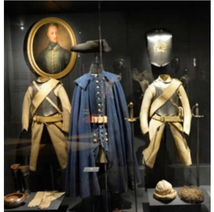
Kaarle XII:n univormuja ja muotokuva. Karoliini-nimitys tulee Kaarle XII:n latinankielisestä nimestä Carolus. Karoliinit olivat Kaarle XI:n ja Kaarle XII:n sotilaita 1676-1719.