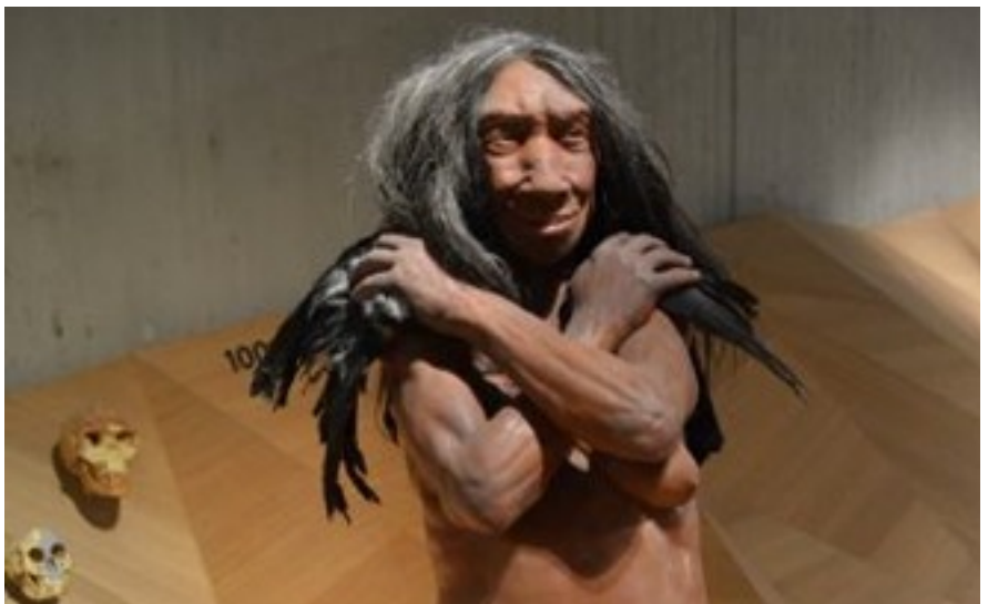
Neanderthal museum performed the development of man.

Next day we went first to Rheinturm, which looked like Näsinneula-tower in Tampere. We enjoyed the beautiful view over the entire city of Düsseldorf and river Rhein. We had some coffee and juice at the cafeteria. Then we went shopping together with our friends. Shopping street was full of shops and I found something interesting to buy. We met a mixed group of our Finns and German hosts. We went to restaurant. I ate caesar salad. When we arrived to the host family, they asked how was our my and how I liked Düsseldorf.