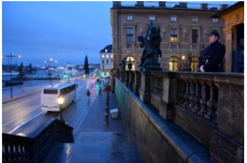
Vartio Tukholman kuninkaanlinnan edustalla.

V iking Linen alus saapuu lähelle keskustaa toisin kuin Silja. Vikingiltä voi hyvin kävellä Vanhaankaupunkiin. Matkan varrella on mm. Fotografiska-valokuvamuseo ja Slussen. Laiva on perillä aikaisin aamulla ja Tukholma alkaa avautua vasta noin kello 10-11. Sen takia kuvauskohteet, Slussen ja Vanhakaupunki, puolsivat paikkaansa kuvauskohteina.