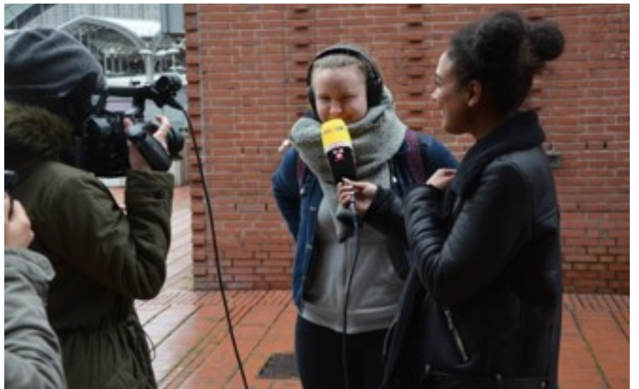
The local TV people managed to urge some of our hosts to sing.