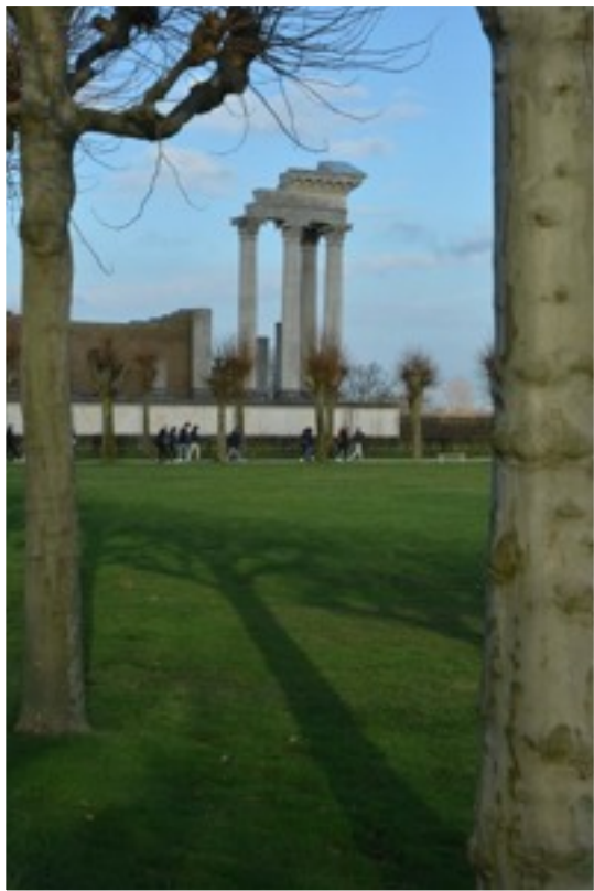
The Museum of Roman settlement in Xanten has an archeological park which is huge.