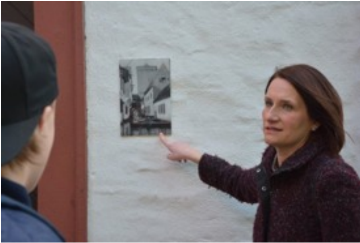
Our guide showed damage cause by flood in Zons.