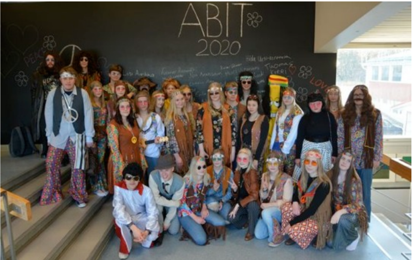
A group photo.