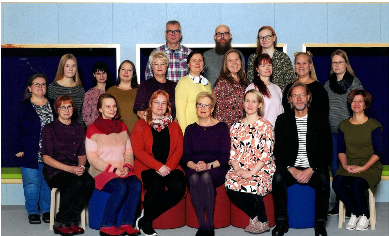
Koulun henkilökunta lv. 2022-2023

Opettajina lukuvuonna 2022-2023 toimivat: