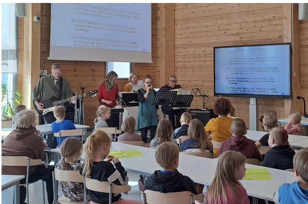
Koulun "houseband" säestää lauluhetkessä. Luluhetki järjestetään koululla aina perjantaisin klo 10.00.