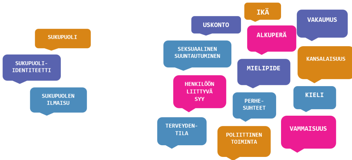
Kuva 1. Tasa-arvolain (oik.) ja yhdenvertaisuuslain periaatteet.