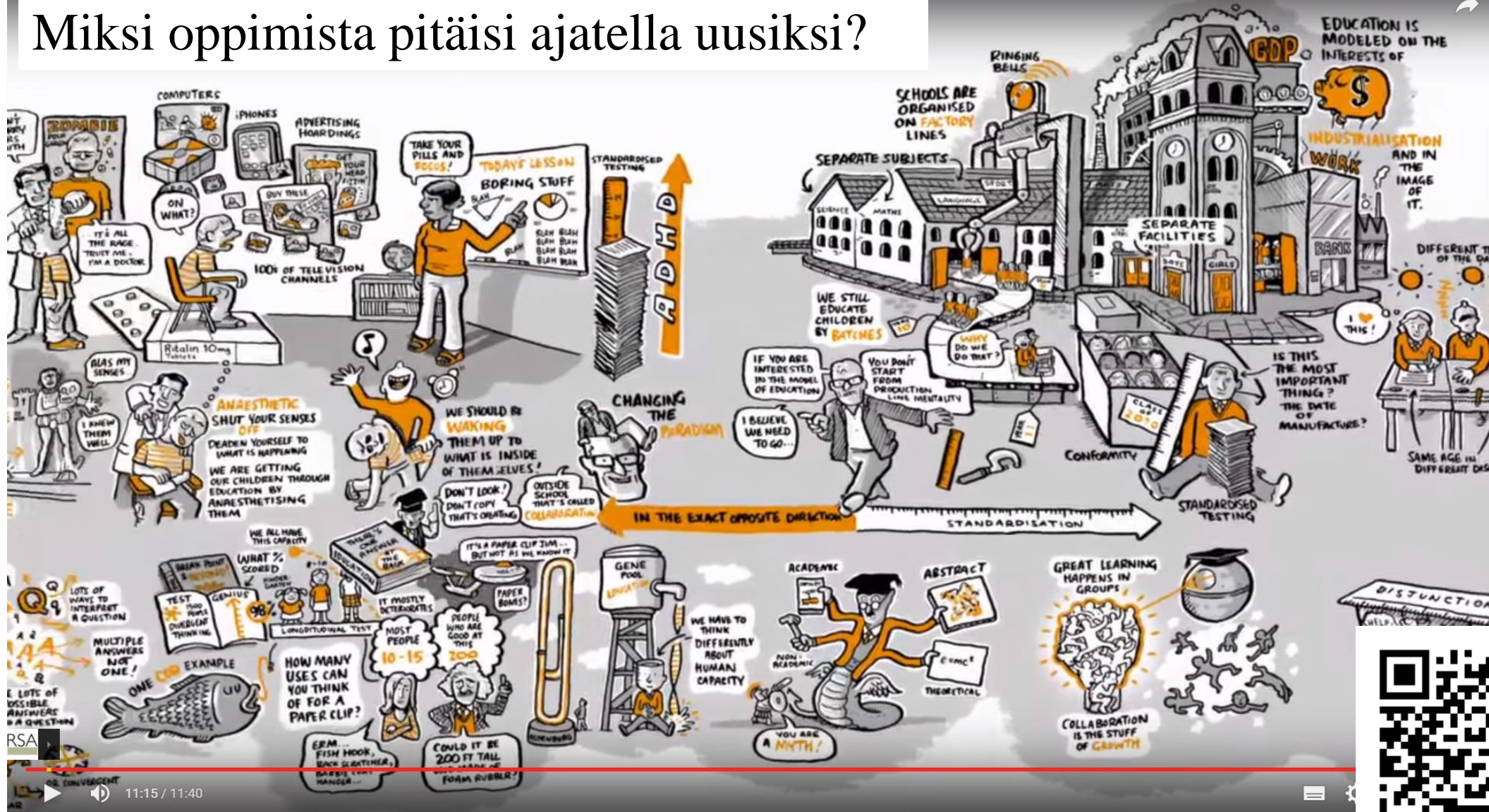
Ken Robinson: Changing education paradigms