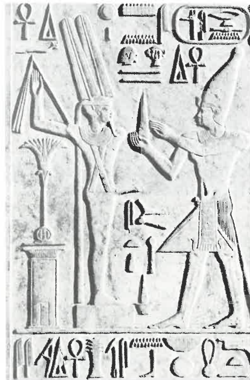
Kuva 2. Kuningas Sesostri I (Keskimmäinen valtakunta) ikuiistettuna uhraamassa valkoista leipää Teeben pääjumalalle Amenille (amen = salattu), joka on kuvattu kolminaisuutena. Hänellä on päässään kaksi sulkaa. Muumionmuotoinen ruumis on Osiriksen, ja phallos ja ruoska kuuluvat Min-jumalalle. Kuninkaalla on päässään eteläisen Egyptin valkoinen kruunu. Uhrin syyksi mainitaan tekstissä: "... jotta hän (so. jumala) antaisi (so. kuninkaalle) elämää, kukoistusta, menestystä ja terveyttä päivittäin, ainaisesti.

Oli myös jumalia, jotka asuivat yksinäisinä paikkakunnillaan. Tällaisiin lukeutuivat mm. hedelmällisyyden jumala Min, jonka palvontapaikkana oli Koptos. Sodan jumalalla Montulla oli temppeli Ermentisissä, Teeben eteläpuolella. Vaikka Montu itse oli haukkapäinen, hänen maallinen inkarnaationsa oli Mnevis-niminen sonni.