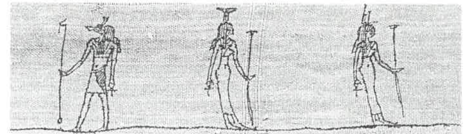
Kuva 4. Esimerkki Egyptiläisestä jumalasta. Vasemmalla koira tai sakaalipäinen, palsamointitaidon jumala Anubis. Oikealla sisarukset Neftys ja Isis. Viimeksimainitun symboli oli "istuim" ja edellisen funktio oli toimia "palatsin herrattarena", so. Horuksen valtaistuimena ja kotina.

Alkukummun huipulle syttyi valo ja levisi sieltä luomakuntaan. Tätä valoa ja sen lähdettä edusti androgyyninen jumala Atum-Ra, joka hedelmöittämällä itse itsensä puhalsi suustaan Šu-ilmanjumalan ja sylkäisi ulos Tefnut-kosteuden. Heidän lapsiaan olivat Nut ja Geb eli taivas ja maa.