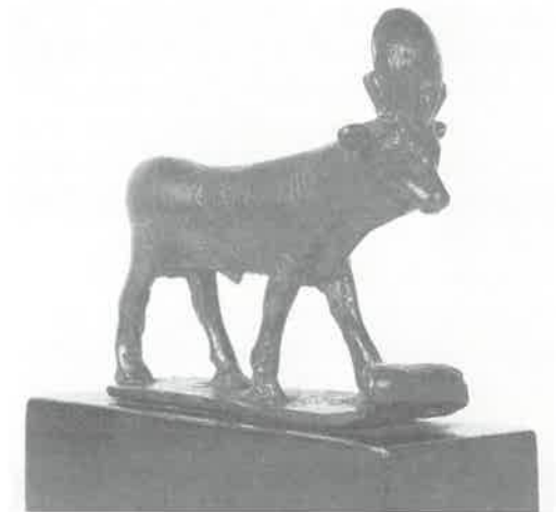
Kuva 1. Apissonni on luojajumala Ptahin, maallinen inkarnaatio. Sonnin tuli olla musta. Otsassa piti olla valkoinen kolmio ja hännässä kolme valkoista hiusta. Apiksen palvontaan liittyi samanlaisia piirteitä kuin Dalai Lamankin kunnioittamiseen. Vanhan kuoltua haettiin samanaikaisesti syntynyttä uutta kohdetta.

Muinaisessa Egyptissä jumalien uskottiin muodostaneen perheitä, ns. triadeja, joihin sisältyivät isä, äiti ja lapsi. Triadit vaihtelivat paikkakunnasta riippuen, siten suosien ja edistäen egyptiläistä polyteismia.