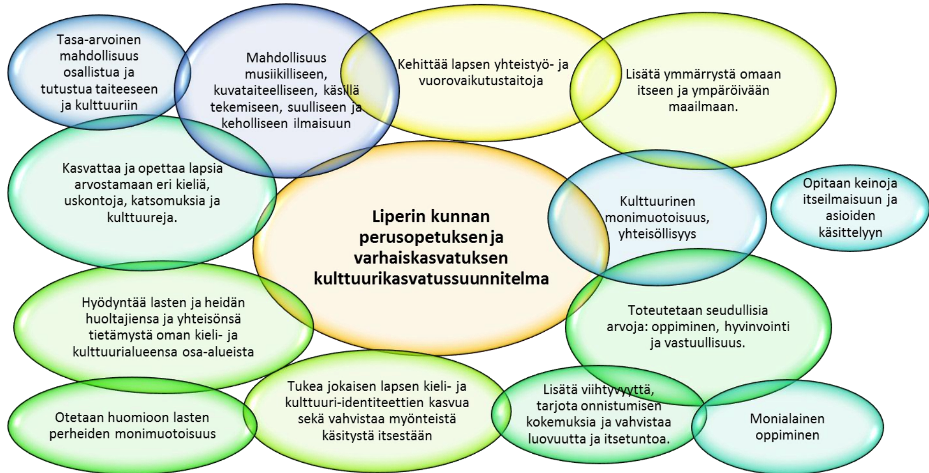
Kuva 2. Liperin kunnan perusopetuksen ja varhaiskasvatuksen kulttuurikasvatussuunnitelman tavoitteet