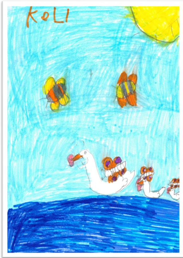
Kuva: Meea (kaikki lehden kuvat ovat e-2 -luokkalaisten tekemiä)

Minä aijon uida mökillä, syödä jäätelöä kotona ja ulkona ja ulkoilla kotona ja muualla kesälomalla.