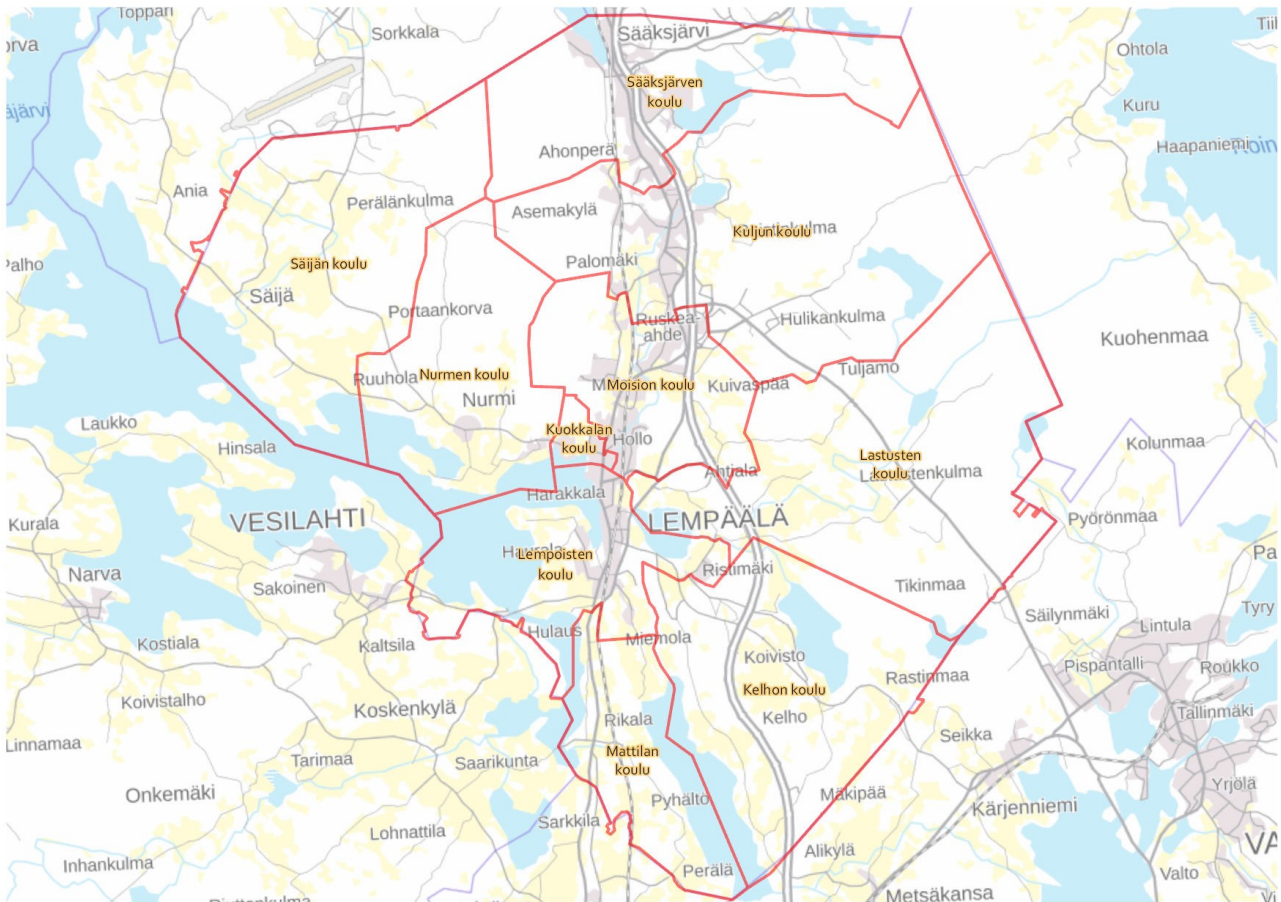
Kartta 1: Oppilaaksiottoalueet lukuvuodelle 2020-2021

Oppilaaksiottoalueiden rajamuutos Kuljun ja Sääksjärven koulujen välillä siirtyy etelään siten, että uusi raja noudattaa Tampereetien itäpuolella valtatie 3:n yhdystietä ja länsipuolella Kiimakalliontietä Härkilevontielle ja sen kuviteltua jatketta länsi-lounaaseen. Päätöksen myötä noin 70 oppilasta siirtyy Kuljun koulusta Sääksjärven kouluun syksyllä 2021. Useimpien siirtyvien oppilaiden koulumatka lyhenee muutoksen myötä. Koulut ovat yhteydessä huoltajiin ja oppilaisiin, joita muutos koskee.