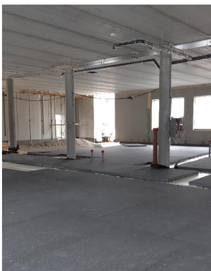
Kuva 1. DA-osalla asennettu lattian lämmöneristeitä.

Paikallavalutyöt D-osa Väestönsuojan seinien valutyöt Viemäriasennus D-osa