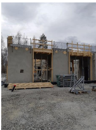
Kuva 2. Kirjaston sisäänkäynnin seinäelementit asennettu