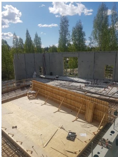
Kuva 1. Koulun aulan katsomon ympärillä olevan paikallavalurakenteen muotti- ja raudoitustyöt.

C-D yhdystunnelin muottityöt Maanvaraisen lattian raudoitustyöt DA Vesikaton höyrynsulku DA-osalla Liittymärakenteiden purku