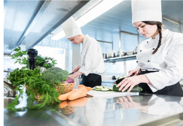
Perustutkinto 180 osp