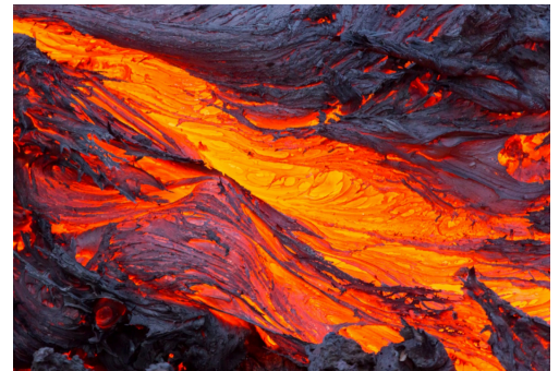
Sulaa kiveä eli laavaa