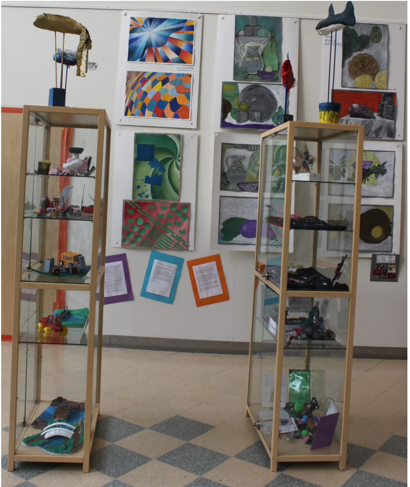
Kuva Sydän-Laukaan koulun ja Laukaan lukion näyttelystä Laukaan kirjastossa