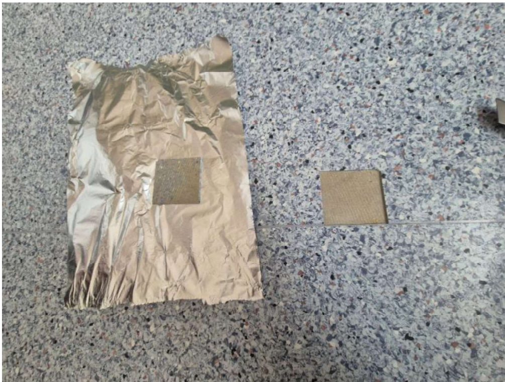
Kuva 1 Materiaalinäyte 1 Tila 079 MABIO2 (vastaavasta kohdasta otettu VOC näyte myös vuonna 2019)

Näyte ja mittauspaikat esitetty paikannuskuvassa.