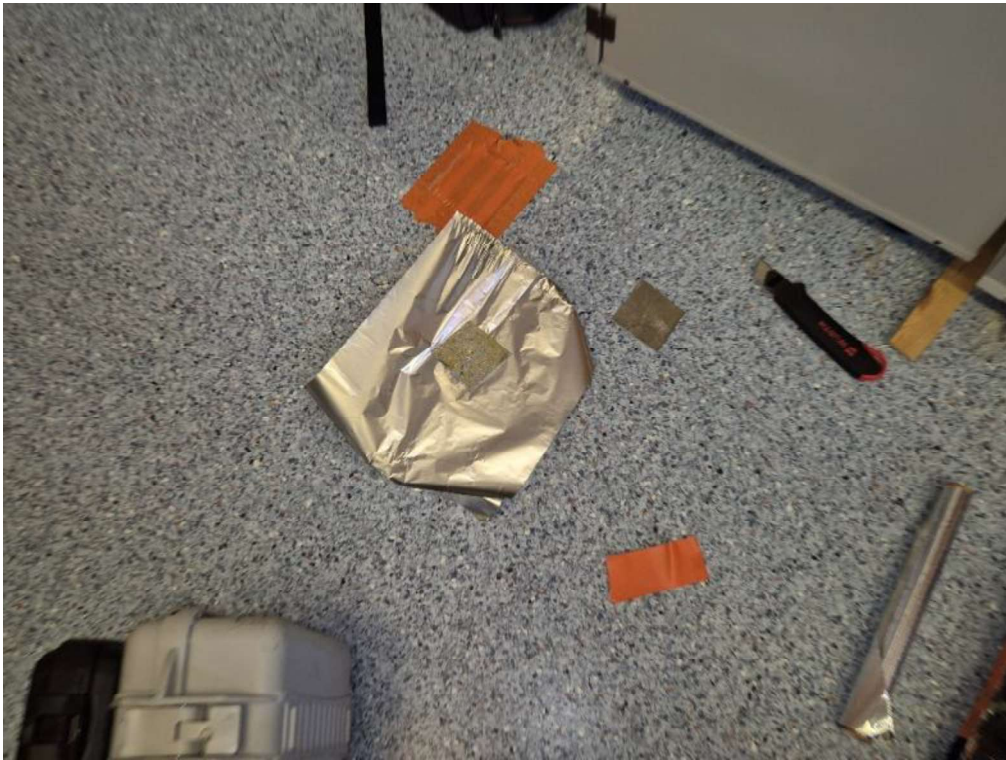
Kuva 4. Materiaalinäyte 4 Tila 159 FYKE-varasto (vastaavasta kohdasta otettu VOC näyte myös vuonna 2019)