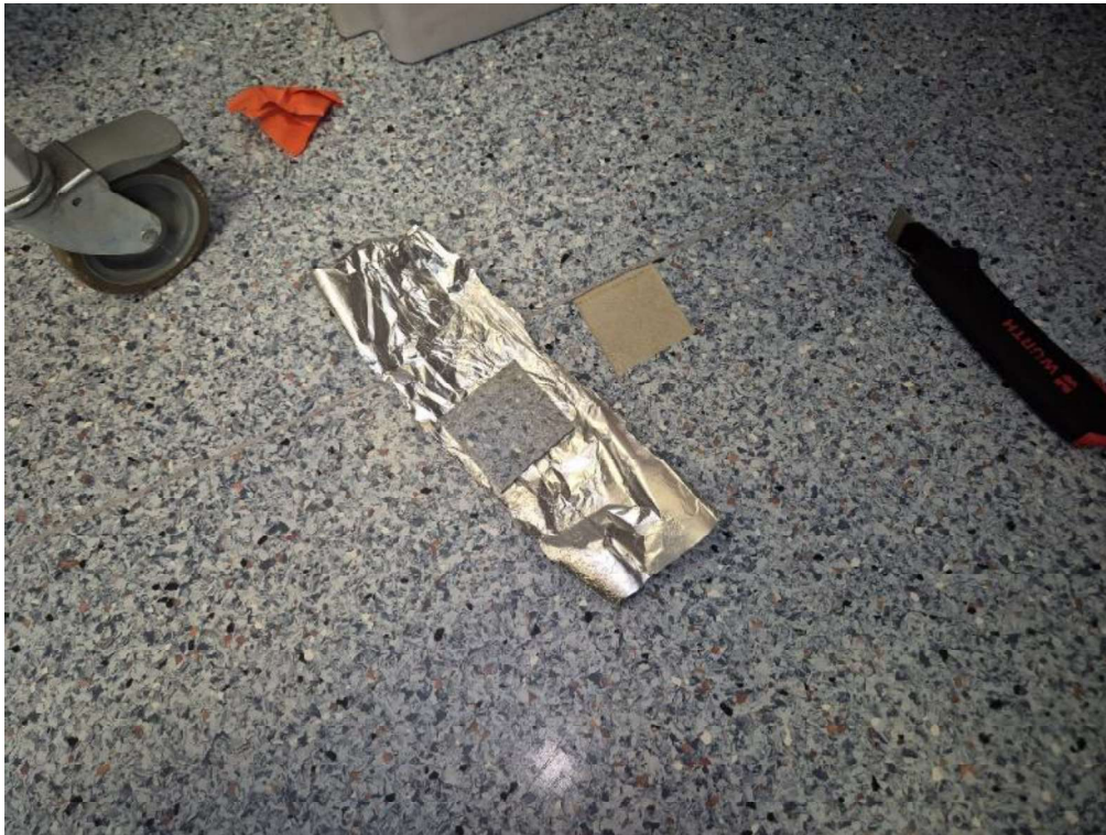
Kuva 2 Materiaalinäyte 2 Tila 078 MABIO-varasto