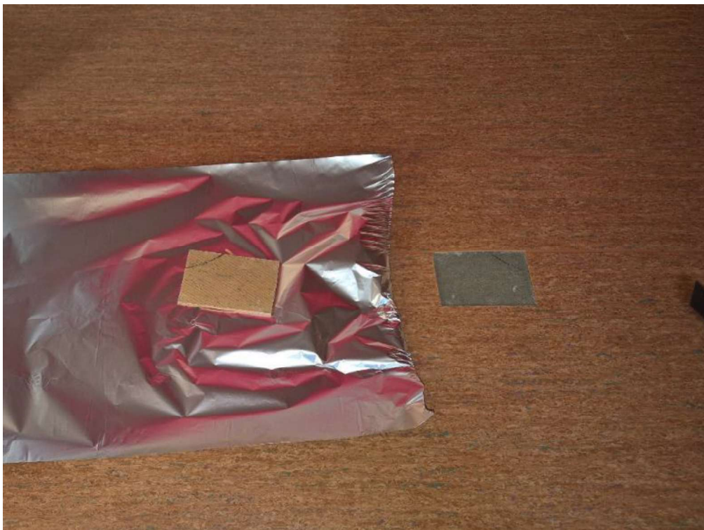
Kuva 3 Materiaalinäyte 3 Tila 153 Rehtorin huone