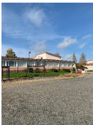
kuva 1. Yläkoulurakennus ja piha-alue

Fyysisenä oppimisympäristönä Varpaisjärven koululla toimii kaksi eri kiinteistörakennusta, jotka sijaitseva samalla tontilla. Oppilaille voi olla opetusta molemmissa koulurakennuksissa, vaikka pääsääntöisesti alakoulun oppitunnit järjestetään toisessa rakennuksessa ja yläkoulun pidetään tunnit toisessa rakennuksessa. Sosiaalisena toimintaympäristönä on koulu yhteisö ja meidän kaikkien koulu - henki, jossa korostuvat arvomme.