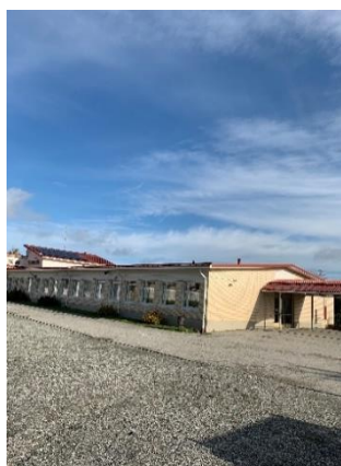
kuva 2. Alakoulurakennus