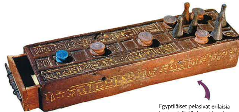
Egyptiläiset pelasivat erilaisia lautapelejä. Yksi vanhimmista peleistä on senet, jonka säännöistä historiantutkijat eivät ole varmoja.

Egyptiläiset arvostivat kauneutta. Sekä miehet että naiset käyttivät peruukkeja, koruja, meikkejä ja hajuvesiä. Vaatteet tehtiin pellavasta. Rikkaat naiset pukeutuivat joskus helmikoristeltuihin vaatteisiin ja miehet koristeellisiin viittoihin. Jalkineina olivat nahasta tai kaisloista tehty sandaalit.