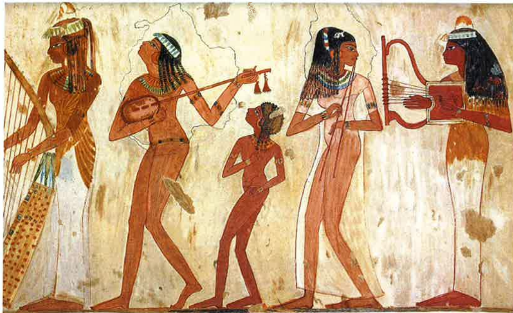
Egyptiläiset naiset soittivat juhlassa lyyraa, huilua ja luuttua. Usein he myös pitivät tanssiesityksiä.