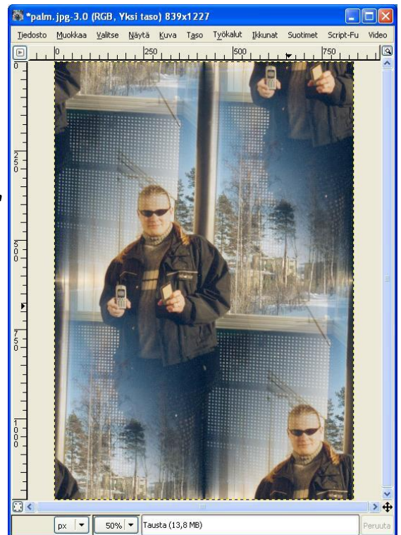
Kuva 3. Saumattomasti jatkuva.