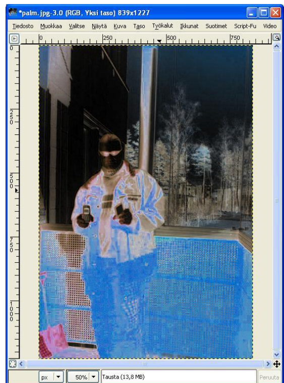
Kuva 2. Valokuvan negatiivi