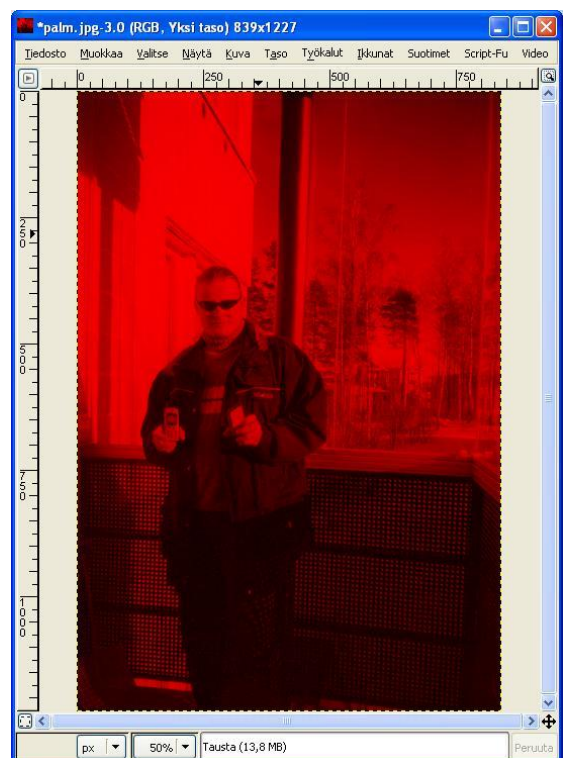
Kuva 4. Ainoastaan punaisella väritetty kuva.

Tämä värittää kaiken yhden värin eri tummuusasteilla.