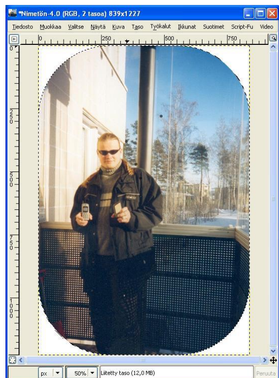
Kuva 5. Pyörästetyt reunat.