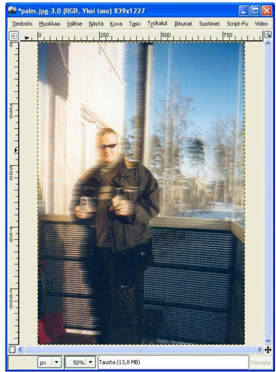
Kuva 1. Tuulinen kuva