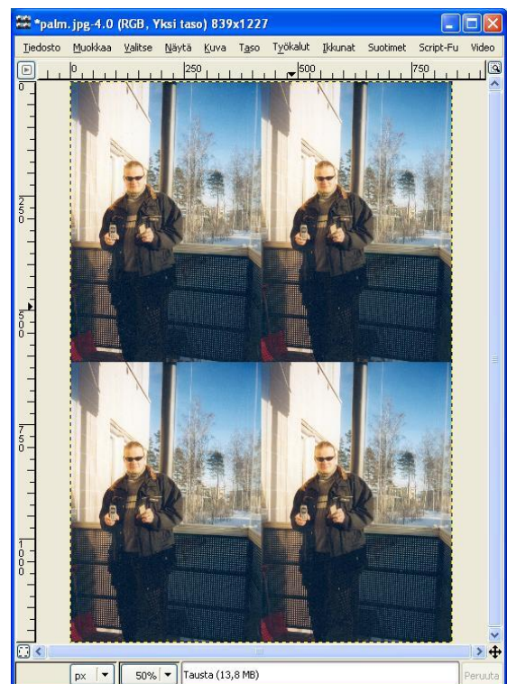
Kuva 3. Valokuva nelinkertaisena: laatoitus.