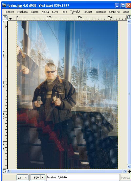
Kuva 2. Aika eteerinen kuva (illuusio).