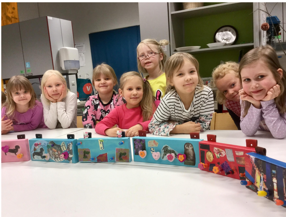
Itselle tärkeitä asiat kuvina oman huoneen naulakossa.

Varhaisiän opinnot järjestetään yhdessä aikuisen kanssa 2-6 -vuotiaille ja ikäryhmittäin 5-6 -vuotiaille. Oppilaalla on mahdollisuus aloittaa opinnot lasten ja aikuisten yhteisissä opinnoissa ja jatkaa oman ikäryhmänsä opinnoissa, opintoja voi myös yhdistellä oppilaan omaan oppimispolkuun sopivalla tavalla. Opintojen sisällöt laaditaan vuosittain vaihtuvan aihekokonaisuuden pohjalta.