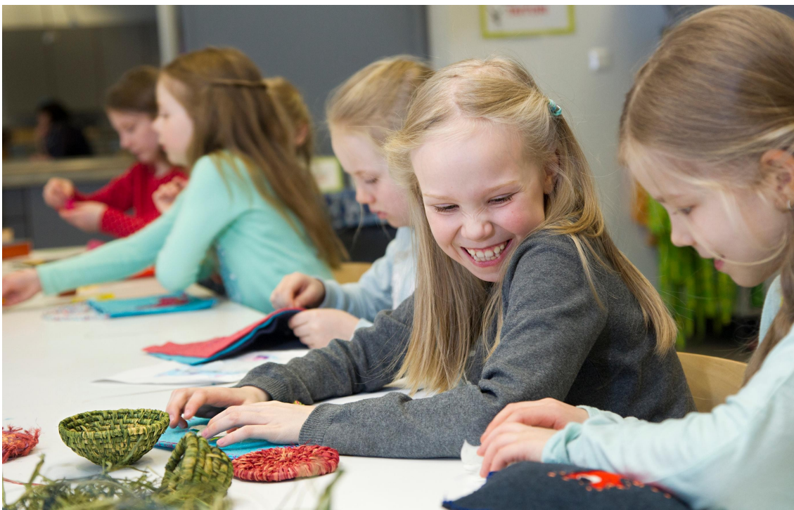
Kulttuurien moninaisuutta: afrikkalaista punontaa ja eteläamerikkalaista ompelua.

Opetuksen tavoitteena on auttaa oppilasta näkemään käsiyö monitieteisenä ilmiönä. Oppilasta innostetaan tarkastelemaan käsiyön, taiteiden ja tieteiden yhteyksiä sekä löytämään niistä uusia oivalluksia. Oppilasta kannustetaan ideoimaan ja rakentamaan uutta. Opintojen tavoitteena on innostaa oppilasta käsiyön, kulttuurin ja muotoilun elinikäiseen harrastamiseen.