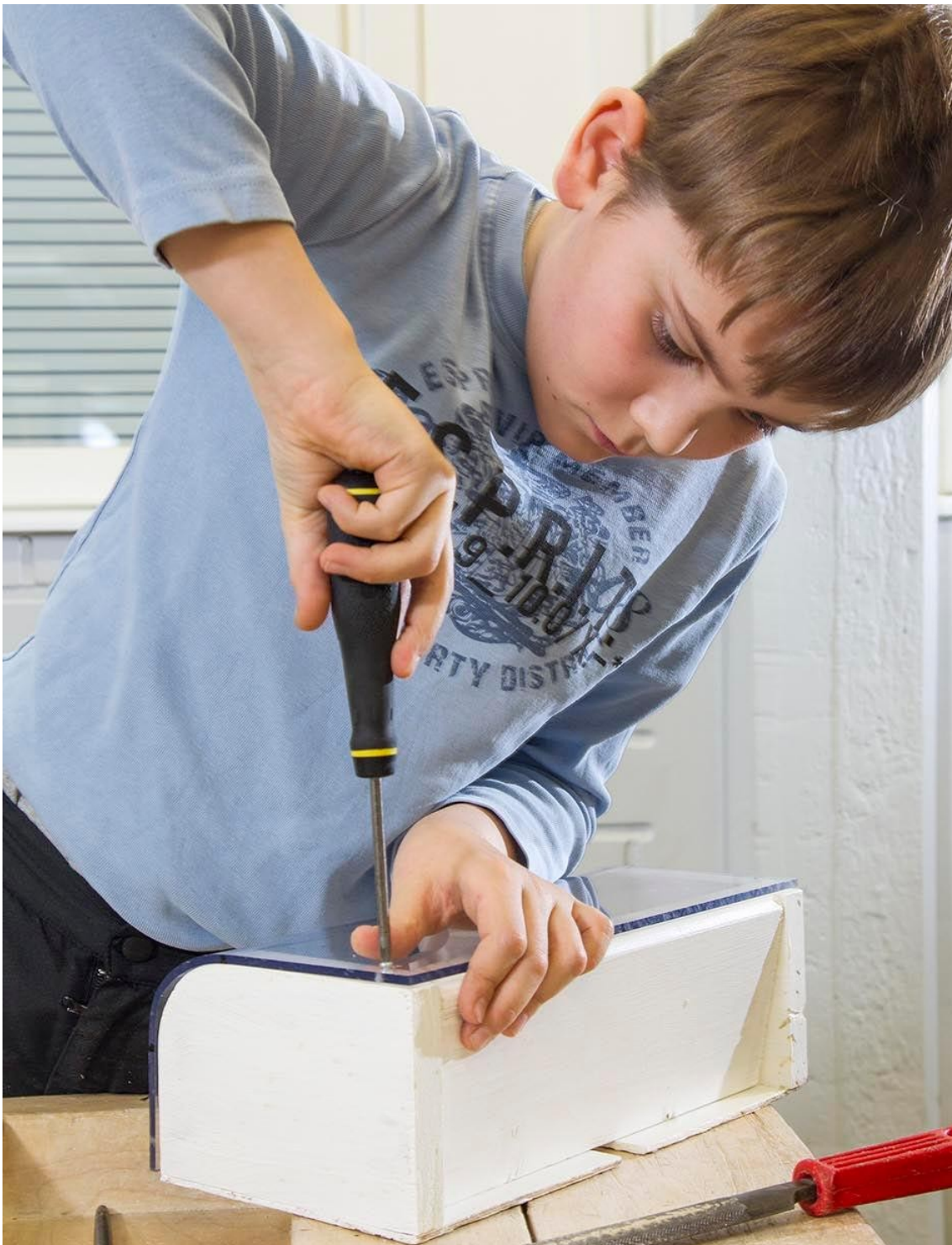
Muotoa eri materiaaleihin puu- ja metallityökurssilla.