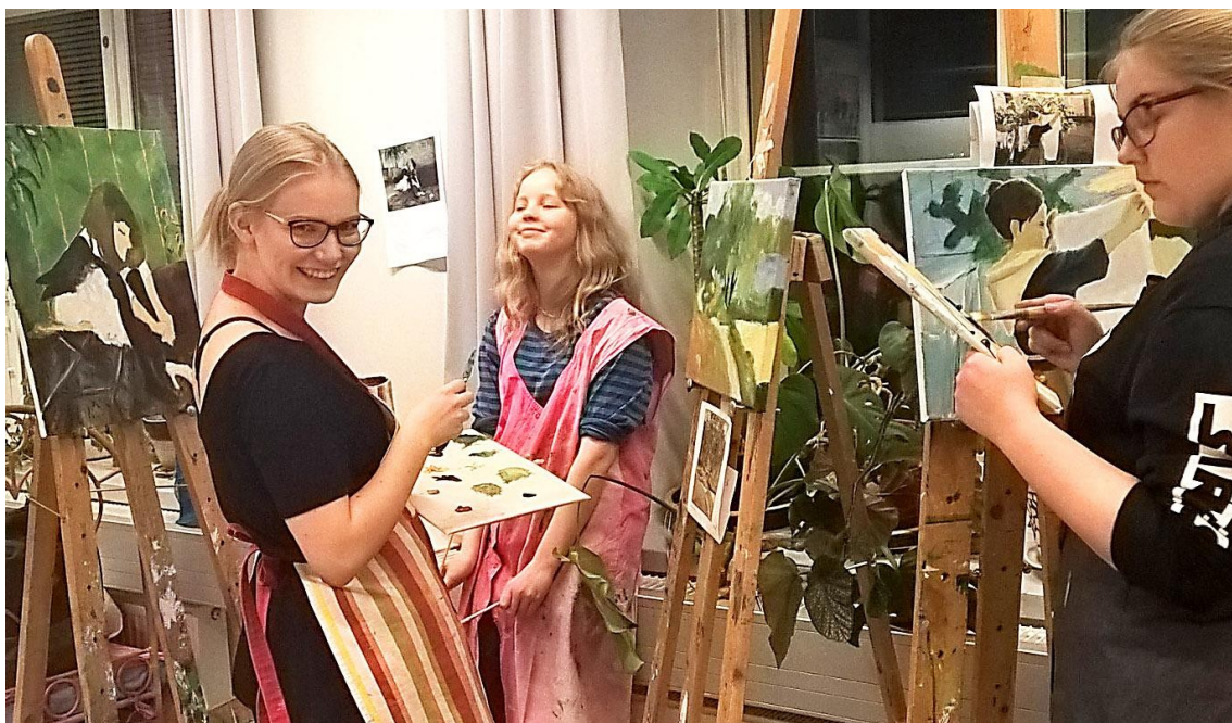
Nuorten piirustuksen ja maalauksen työpajan toimintaa 2017-18

Opetuksessa tutkitaan erilaisia luonnonympäristöjä, rakennettuja ympäristöjä, esineympäristöjä, mediaympäristöjä ja visuaalisia osakulttuureja. Opintoissa harjoitellaan visuaalisen ympäristön esteettistä, ekologista ja eettistä arvottamista sekä käsitellään ympäristön merkitysten rakentumista.