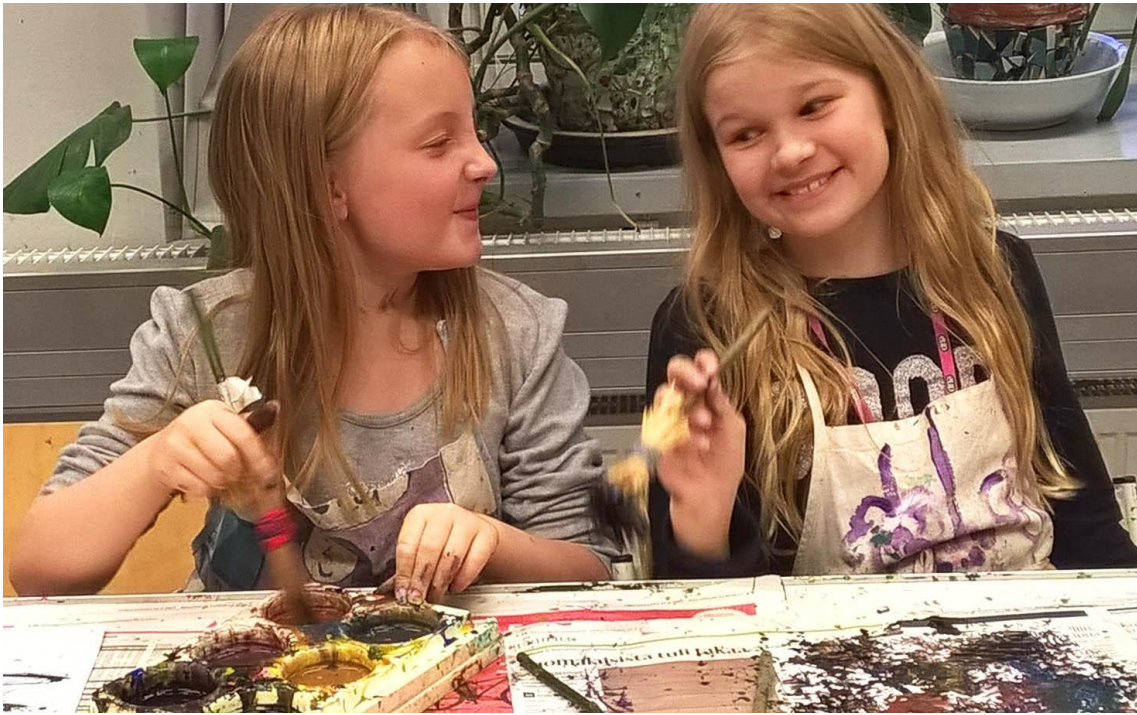
11-15 -vuotiaiden kuvataideryhmä