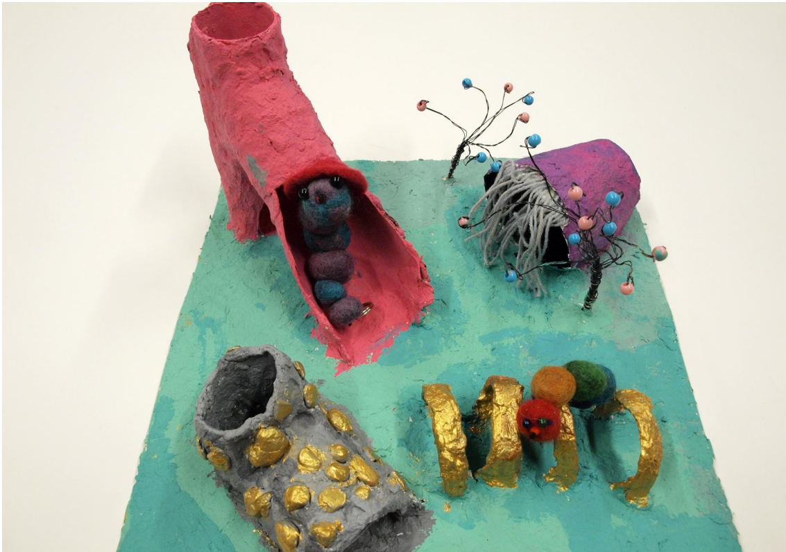
Mielikuvitusta, ideoita ja ihmettelyä: aikamatojen kotiplaneetta.