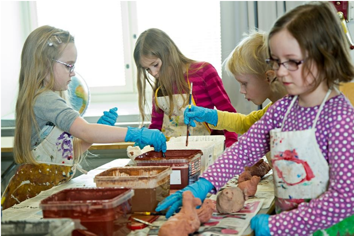
7-9 -vuotiaiden kuvataideryhmä lasittaa arktisia savieläimiä