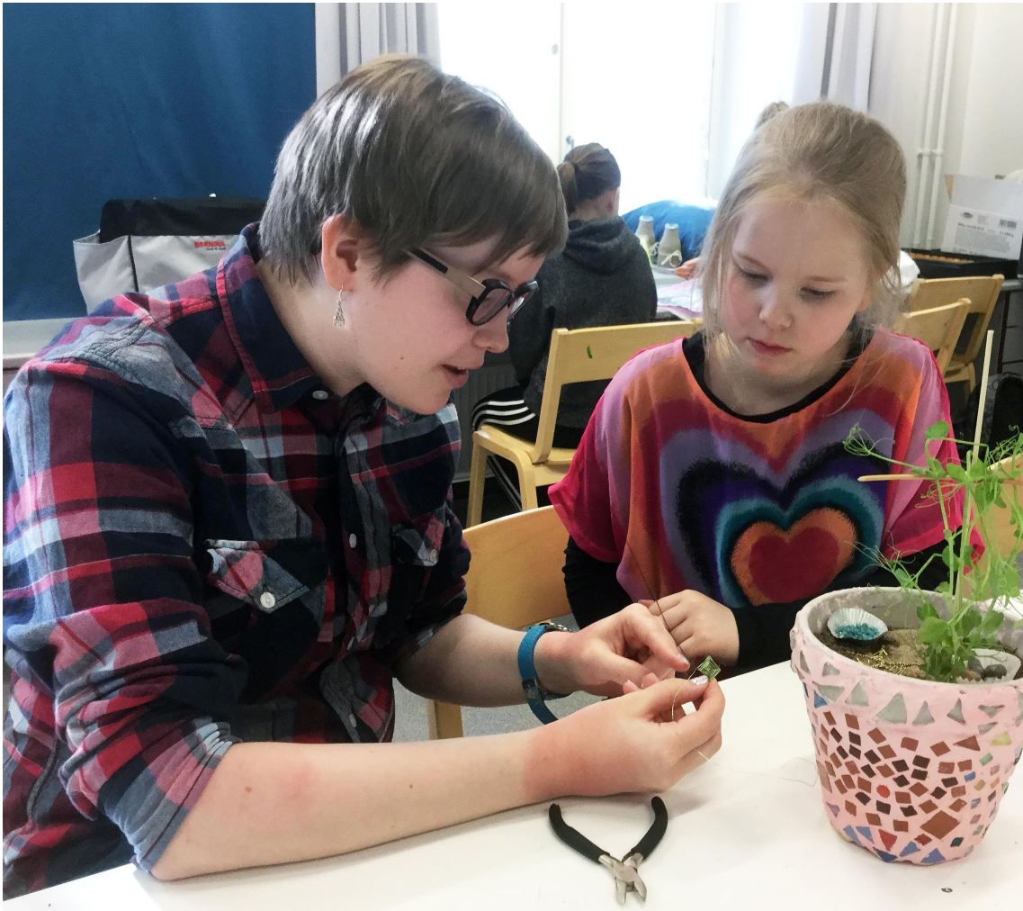
Arviointia koko oppimisprosessin ajan.