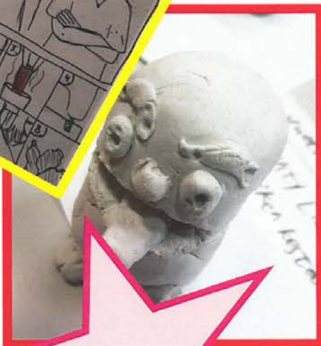
Oppilastöiden kuvat: Yhtenäiskoulun opettajat ja oppilaat