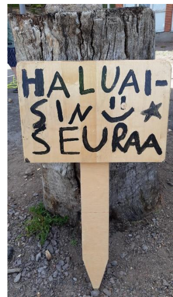
Kuva 2: Haluaisin seuraa -kyltti

Vastuukasvatusta yhteisistä tavaroista huolehtimisesta on luokkaryhmien viikoittainen siivousvuoro, jolloin oppilaat huolehtivat pihavaraston ja välituntivälineiden siivoamisesta .