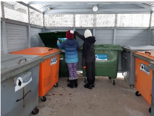
Kuva 3: Oppilaat lajittelevat paperijätettä jätekatoksessa

24.2 talviseen ulkoilupäivään yhdistettiin kestävän kehityksen oppisisältöä ja maaliskuussa vietettiin metsäpäivää ulkona oppimisen merkeissä. 26.4 oli teemaoppitunti jokaiselle luokkaryhmälle luonnon monimuotoisuudesta .