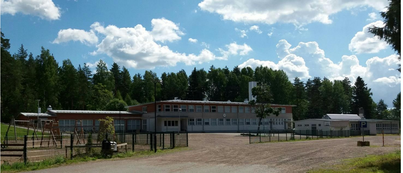
Kuva 1: Sippolan koulu pihalta kuvattuna