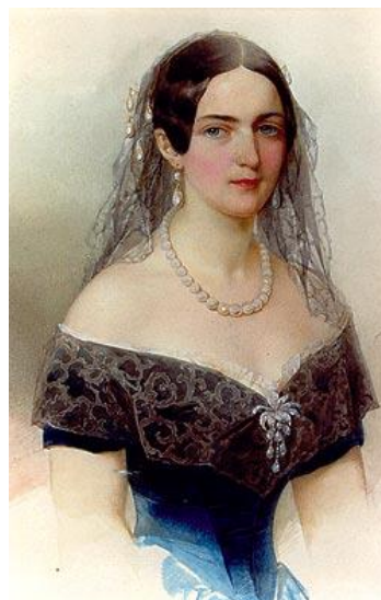
Художник В. И. Гау, 1840-1845 гг.

Упражнение 9. Спишите, вставьте пропущенные орфограммы и запятые, подчеркните причастные обороты.