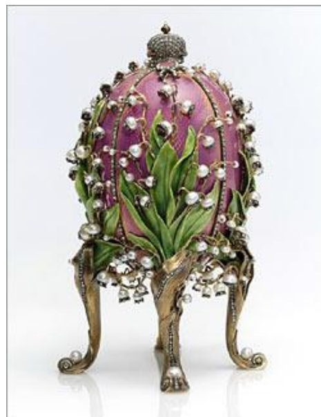
Яйца Фаберже, Ландыши

За 4 года до рождения Карла, в 1842-м, его отец Густав Фаберже, ювелирных дел мастер, основал фирму под собственным именем расположивш...ся в одном из домов на Большой Морской. Но когда Карлу, старшему из его сыновей, исполнилось 14 лет, Густав переселился вместе с семьей в Дрезден. Именно оттуда по настоянию отца Карл отправился в своё большое «плавание» сопровождаемый напутствием Европу посмотреть и ювелирному делу обучиться.