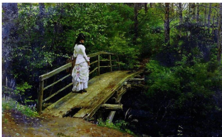
Репин, Летний пейзаж 1879