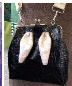
Kuvat: Käsitöitä muksut matkassa • Puu- ja metallityöt • Punotaan kierrätysmateriaaleita koreja ja käyttöesineitä • Tilkkutyöt • Nahkalaukkuja kierrätysnahasta