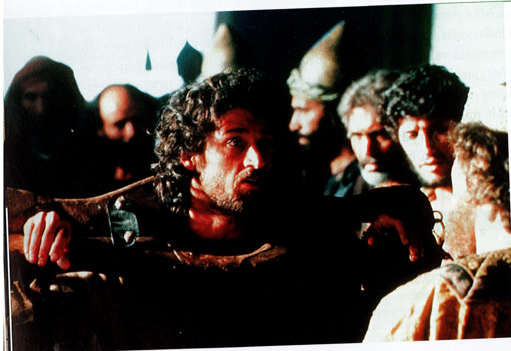
Profeetta Jeremia ennusti Babylonian pakkosiirtolaisuuden ja Jerusalemin temppelin tuhon. Hänellä on harteillaan ies tulevan orjuuden vertauskuvana. Kuva on elokuvasta Jeremiah (1998).

Sanalla profeetta tarkoitetaan uskonnollista julistajaa ja Jumalan tahdon ilmoittajaa. Raamatussa profeetat ovat etenkin Jumalan äänitorvia, jotka arvostelevat kansan väärää elämäntapaa ja vaativat Jumalan tahdon noudattamista. Profeetat aloittavatkin usein julistuksensa sanoilla ”näin sanoo Herra” korostaakseen, etteivät esitä omia ajatuksiaan, vaan puhuvat Jumalan suulla. Vanhassa testamentissa on 16 profeettakirjaa. Kirjojen laajuuden mukaan profeetat jaetaan suuriin ja pieniin profeettoihin. Suuria profeettoja