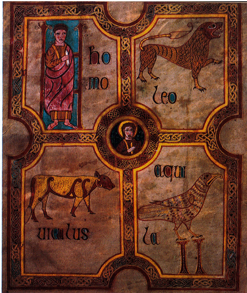
700-luvulta peräisin olevassa evankeliumikirjassa evankelistat on kuvattu tuttuina symboleina. Ihminen kuvaa Matteusta, leijona Markusta, härkä Luukasta ja kotka Johannesta.

Luukkaan evankeliumi on syntynyt 80–90-luvulla luultavasti Roomassa. Luukas kuvaa Jeesuksen pelastajana, jonka kohtaaminen muuttaa ihmisen elämän. Erityisen huomion kohteena ovat ihmiset, joita pidettiin yhteisössään syrjityssä asemassa. Tällaisia kuvauksia ovat esimerkiksi kertomukset laupiaasta samarialaisesta, Sakkeuksesta, syntisestä naisesta fariseuksen luona sekä tuhlaajapöjasta.