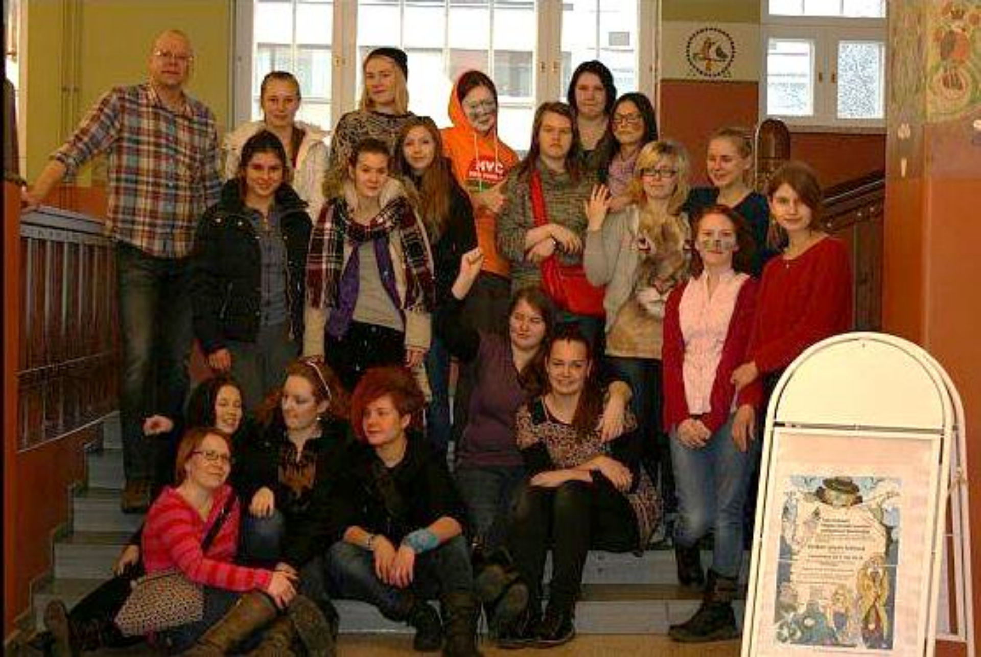
Koko porukka! Kotkan lyseon lukio 2014