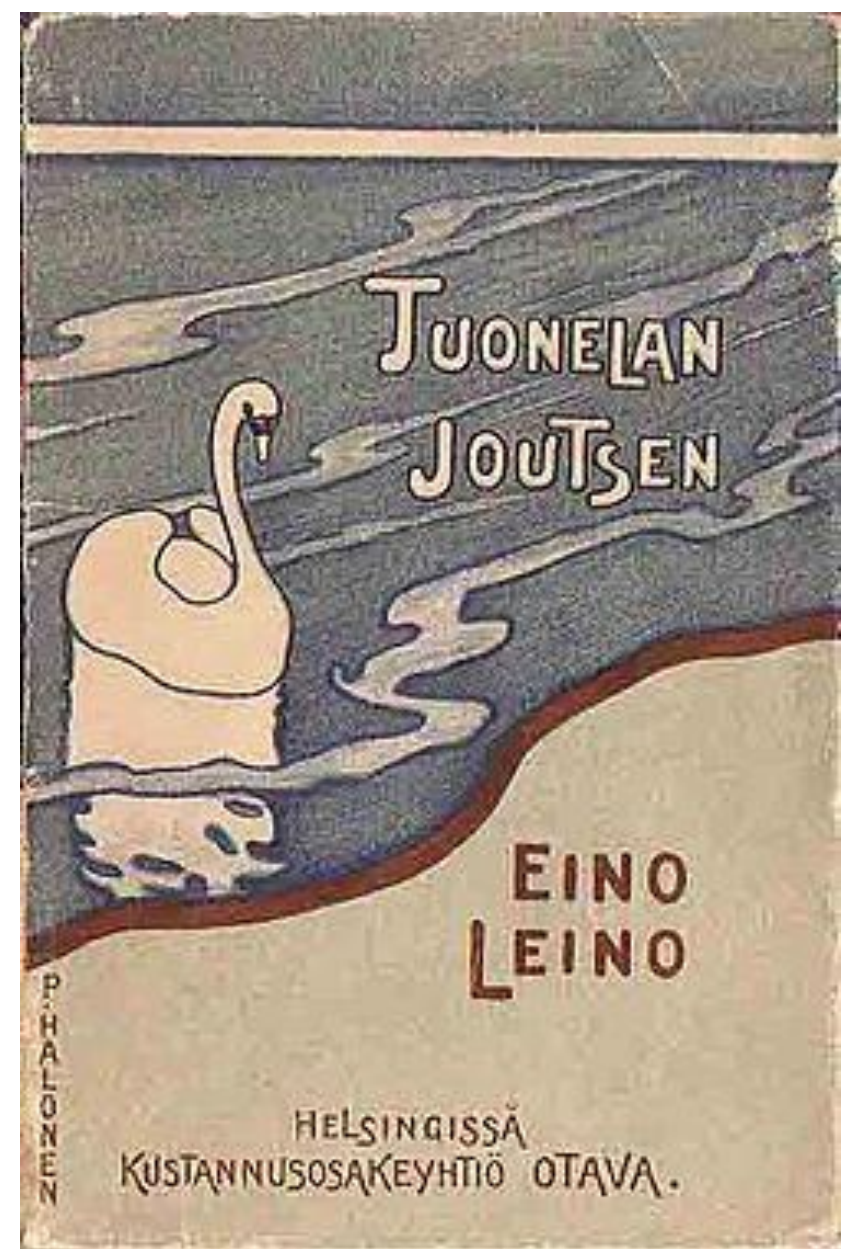
Tuonelan joutsen, näytelmä, 1898 Pekka Halosen suunnittelema kansi