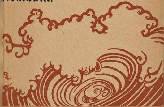
Tuomas Vitikka, romaani, 1967