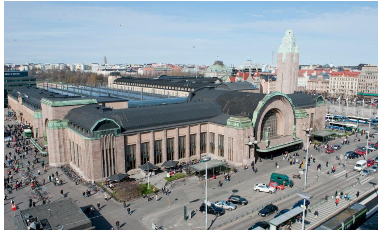
Helsingin päärautatieasema, 1914