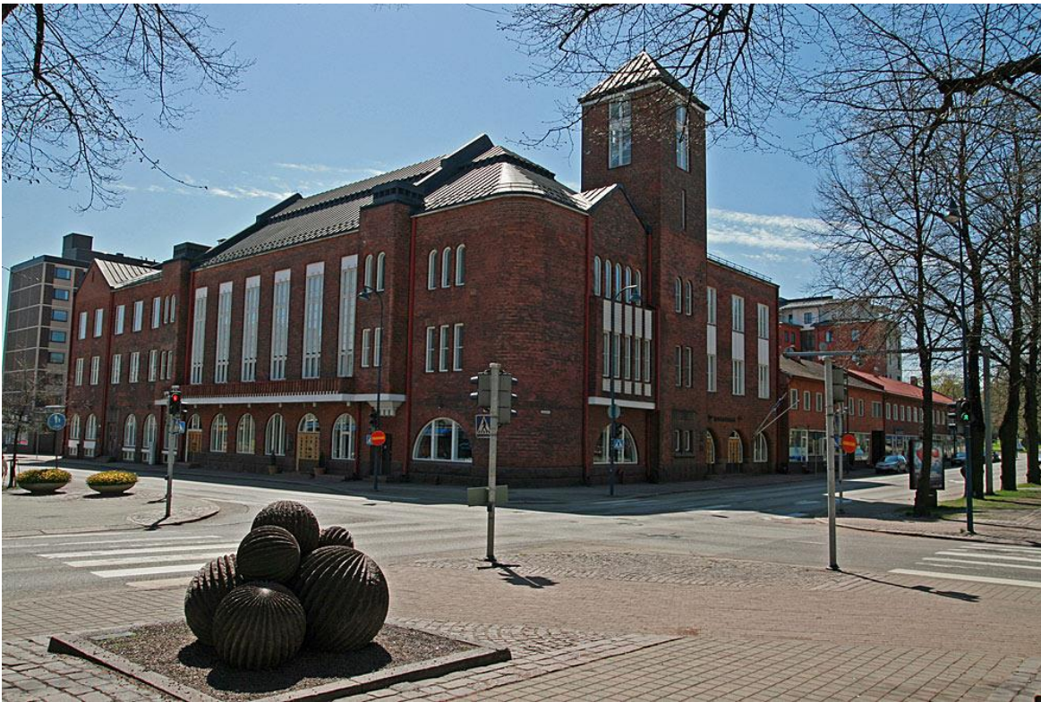
Kotkan konserttitalo, 1907