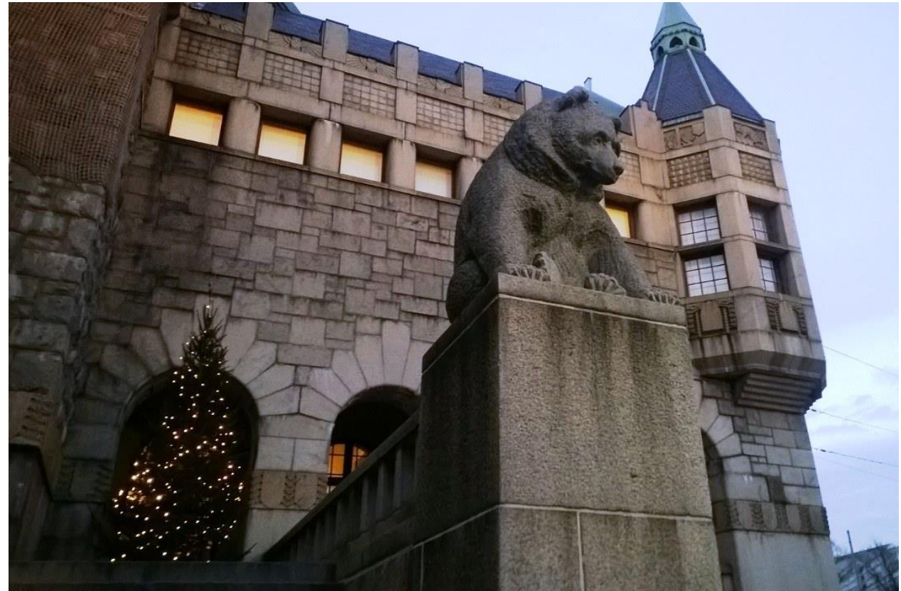
Kansallismuseon Graniittikarhu, 1910