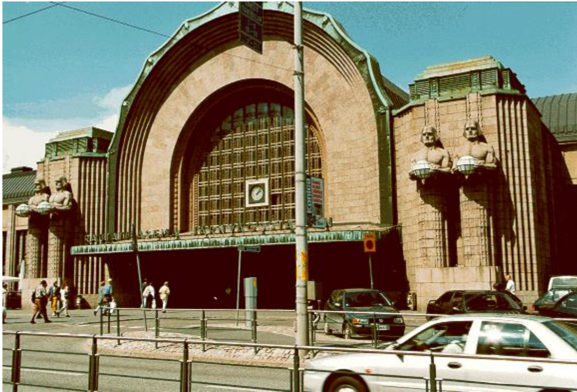
Rautatieaseman Lyhdynkantajat, 1914