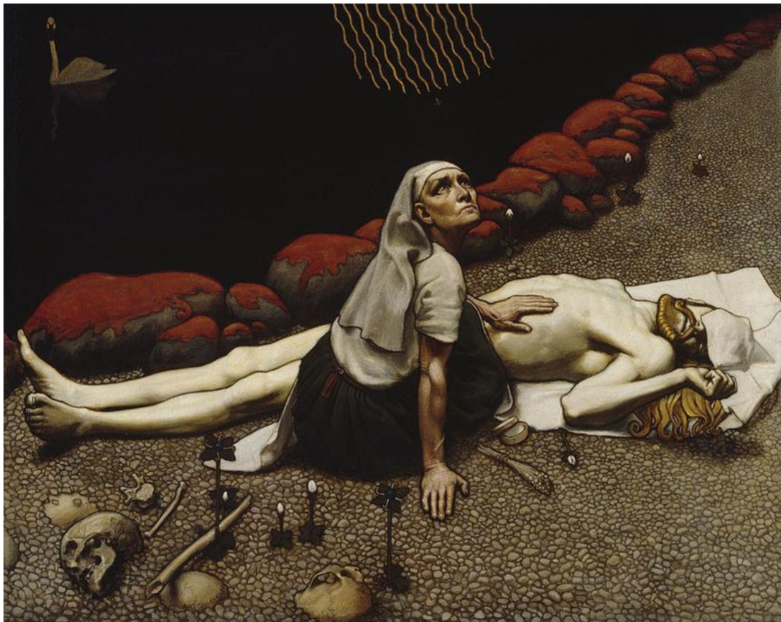
Lemminkäisen äiti, 1897