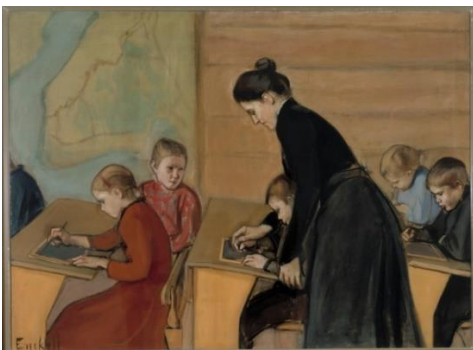
1860-luvulla perustettiin kansakouluja. Opetus oli suomeksi.

Suomen kieli on jatkanut kehitystään myös 1870-luvun jälkeen, jolloin puhutaan nykysuomen kaudesta. Etenkin erikoisalojen ja tekniikan sanastoa on tullut ja tulee koko ajan lisää. Esimerkiksi vuosina 1880–1920 syntyneitä uusia sanoja ovat ammattiyhdistys , polkupyörä ja asiakas , ja 1920–1970-luvuilla kieleen tulivat elokuva , tietokone ja pakastin .