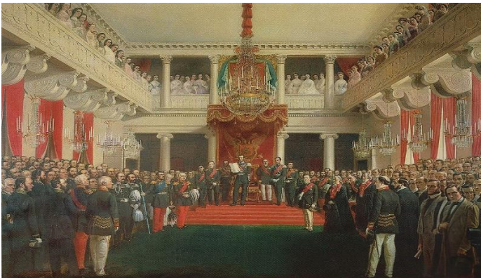
Porvoon valtiopäivät vuonna 1809.

1800-luvun alkupuolella Euroopassa heräsi kansallisromanttinen aate, ja se teki suomen kielen kehittämisen taas ajankohtaiseksi. Kun Suomesta tuli osa Venäjää 1809, venäläiset suosivat aluksi suomalaisten kansallistunnetta. ”Ruotsalaisia emme ole, venäläisiksi emme halua tulla, olkaamme siis suomalaisia.” Suomi tarvitsi oman kielen, jotta se voi perustella oikeutta autonomiaan ja itsenäisyyteen.