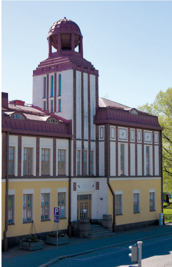
Aikuislukion opetustilat sijaitsevat Globus-talossa, Kotkankatu 13