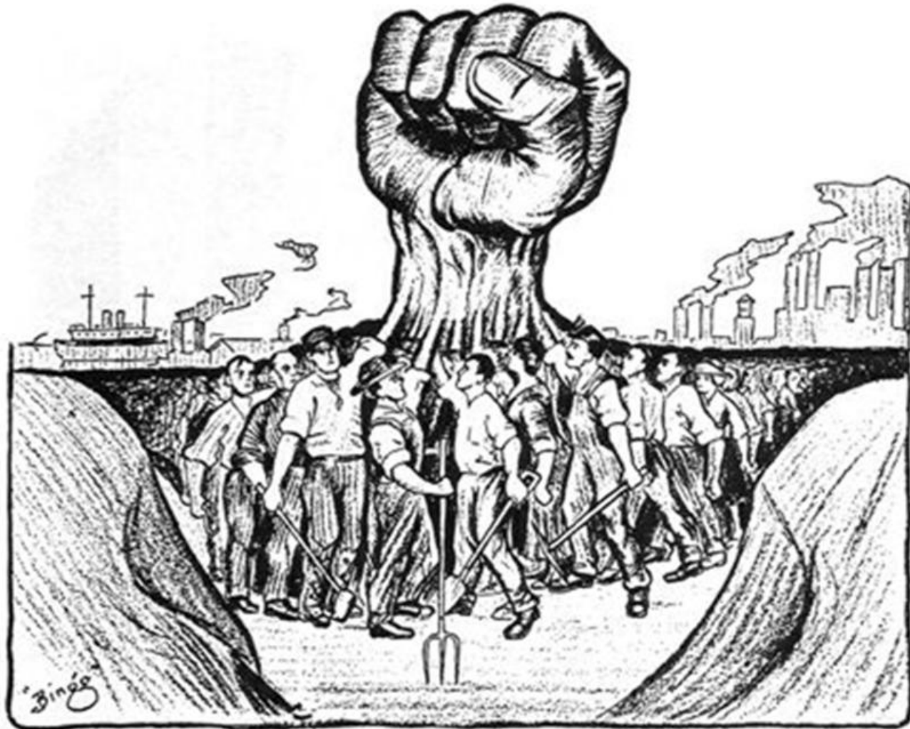
Solidarity, June 30, 1917. The Hand That Will Rule the World—One Big Union.