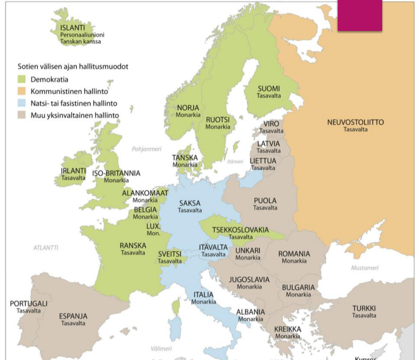
DEMOKRATIAI JA DIKTATUURIT EUROOPASSA VUONNA 1938