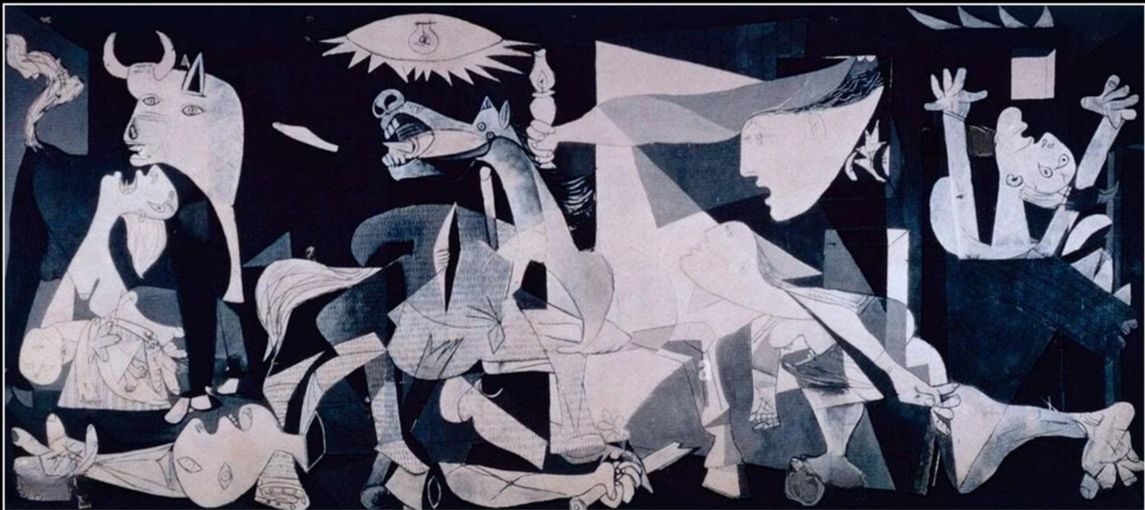
Pablo Picasso: Guernica (1937)