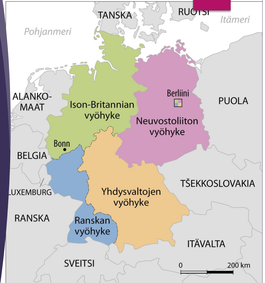
LIITTOUTUNEIDEN MIEHITYSVYÖHYKKEET SAKSASSA 1945–48