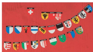
2. Die Alte Eidgenossenschaft der Schweiz wird gegründet. A

Achtung! Joissakin vakiintuneissa käsitteissä myös adjektiivit ja järjestysluvut kirjoitetaan isolla alkukirjaimella.