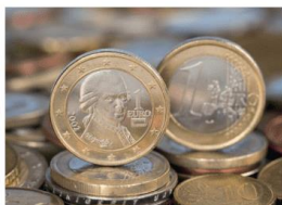
5. Österreich tritt der EU bei. F