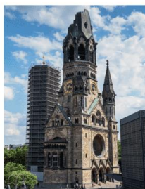
1. Der Zweite Weltkrieg endet. C

Achtung! Joissakin vakiintuneissa käsitteissä myös adjektiivit ja järjestysluvut kirjoitetaan isolla alkukirjaimella.