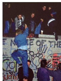
3. Die deutsche Wiedervereinigung findet statt. E