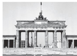
6. Die Berliner Mauer wird gebaut. D