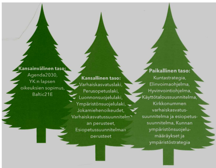
Kuvio 5. Ympäristökasvatusta ohjaavat lait ja asiakirjat