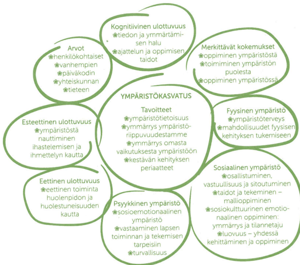
Kuvio 1. Ympäristökasvatuksen tavoitteet ja oppimiseen vaikuttavat tekijät

Opetussuunnitelmissa korostuu luontokokemusten tarjoaminen lapsille, sekä mahdollisuus tutkia ja tutustua kasveihin, eläimiin ja luonnonilmiöihin. Luomme pohjaa kestäväle elämäntavalle luonnonsuojeluun tutustumalla ja ohjaamalla huolehtimaan ympäristöstämme ja sen viihtyisyydestä.