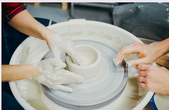
Käsipari muovaa saviastiaa dreijalla. Opettajan kädet lepäävät dreijan reunalla.