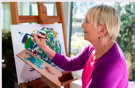
Nainen maalaa abstraktia teosta maalaustelineen ääressä.