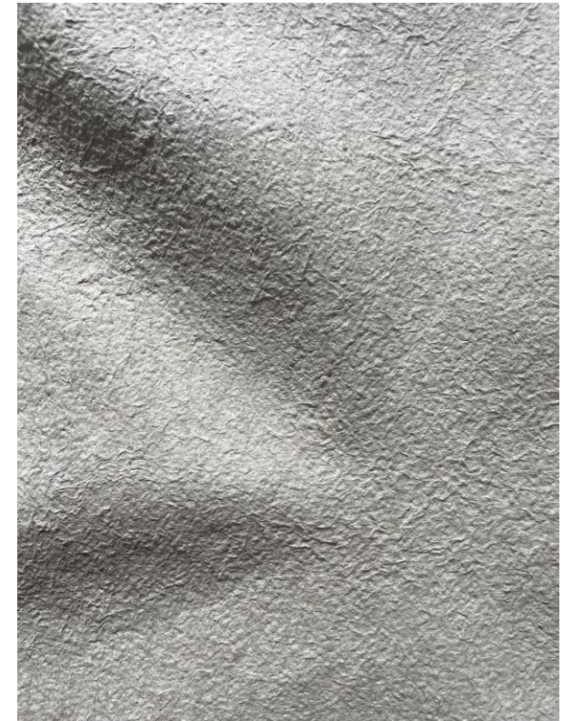
Kokeiluita paperimassan koostumuksesta