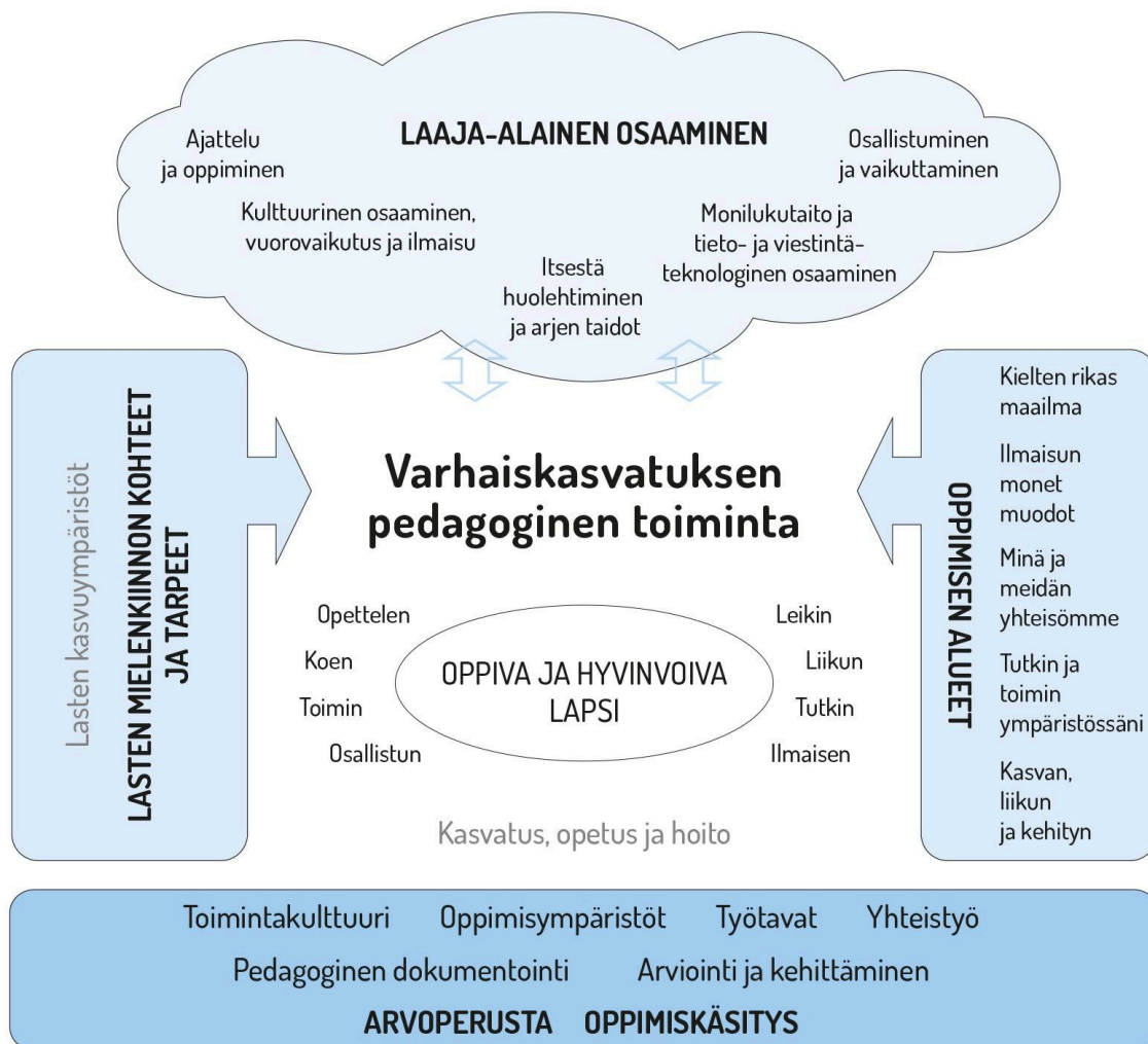
Kuvio 1. Varhaiskasvatuksen pedagogisen toiminnan viitekehys

Varhaiskasvatuksen pedagogista toimintaa ja sen toteuttamista kuvaa kokonaisvaltaisuus. Tavoitteena on edistää lasten oppimista ja hyvinvointia sekä laaja-alaista osaamista (kuvio 1). Pedagoginen toiminta toteutuu lasten ja henkilöstön välisessä vuorovaikutuksessa ja yhteisessä toiminnassa. Lasten omaehtoinen, henkilöstön ja lasten yhdessä ideoima sekä henkilöstön johdolla suunniteltu toiminta täydentävät toisiaan. Varhaiskasvatuksen pedagoginen toiminta läpäisee kasvatuksen, opetuksen ja hoidon kokonaisuuden.