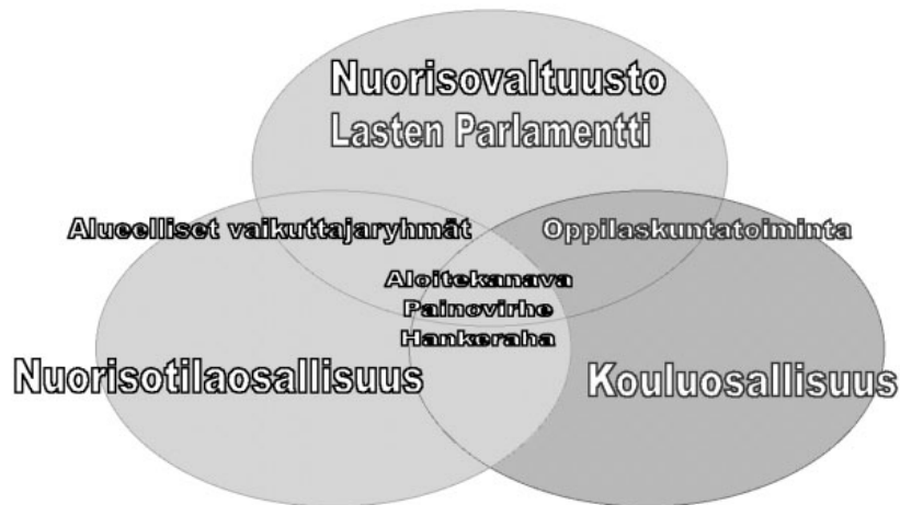
Kuvio 1. Lasten ja nuorten vaikuttamismahdollisuudet Jyväskylässä. Opetuspalvelut vastaa Lasten Parlamentin toiminnasta ja nuorisopalvelut nuorisovaltuuston toiminnasta. Käyhkö 2009