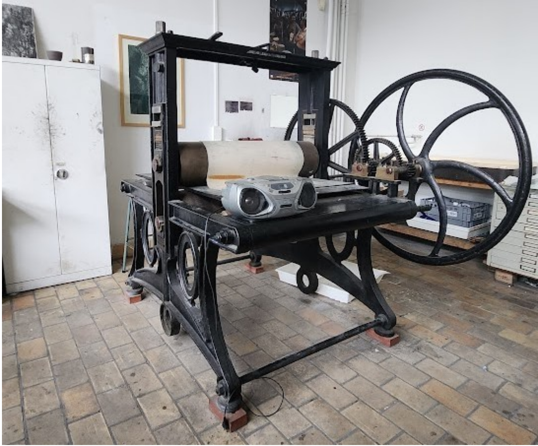
Painokone 1800-luvulta akatemialta (ja “moderni” audiolaite).