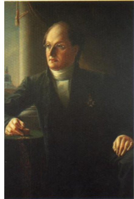
Johan Ludvig Runeberg