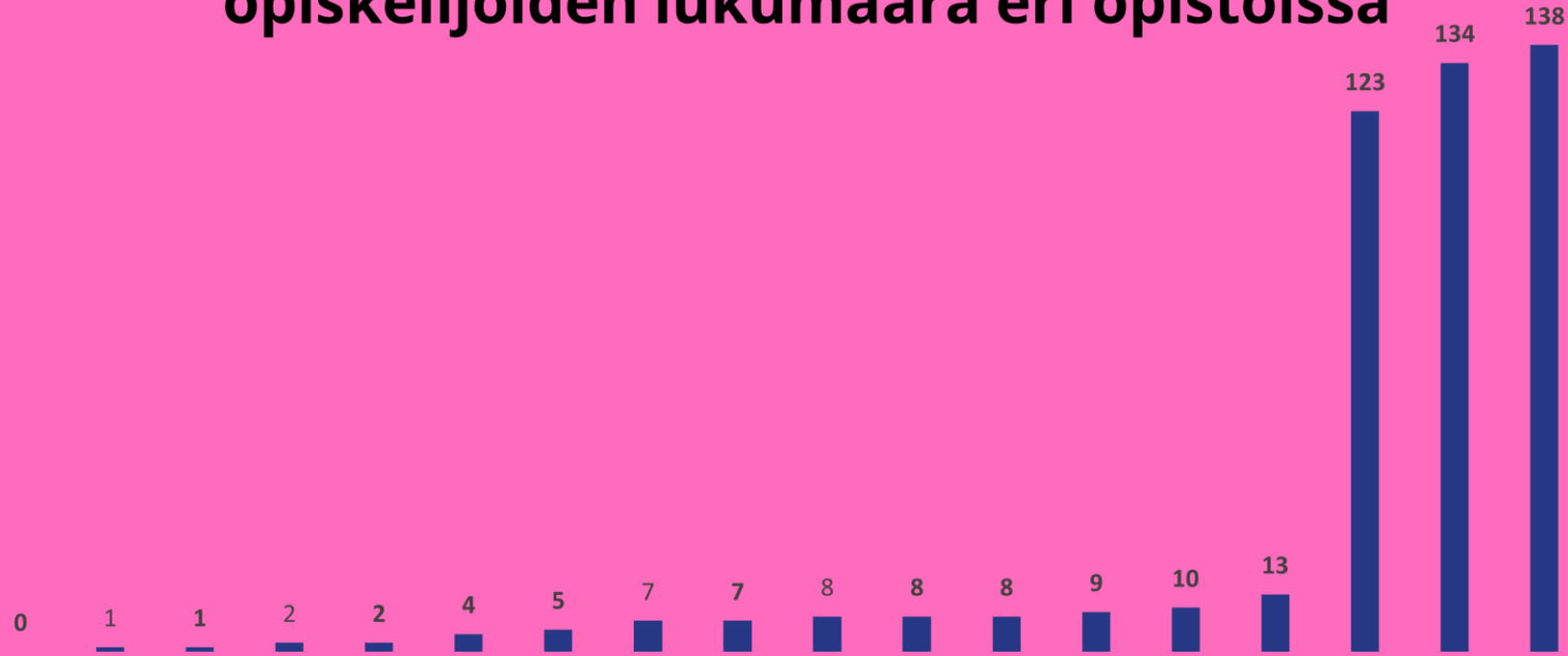
Opistovuosi-koulutuksessa olevien opiskelijoiden lukumäärä eri opistoissa

Opistovuosi-opiskelijoita yhteensä 471 kyselyyn osallistuneissa kansanopistoissa.