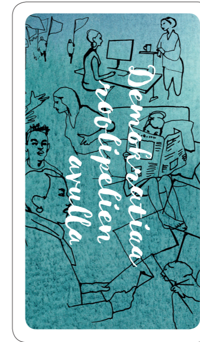
Demokratiaa roolipelien avulla