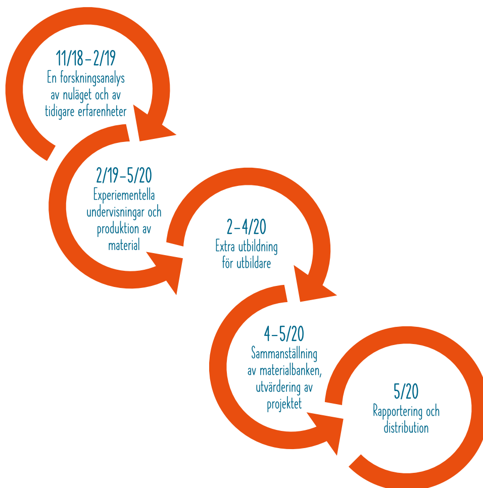
Bild 1. ADEKA-projektets processdiagram.

Projektets arbetsprocess återges i bild 1.