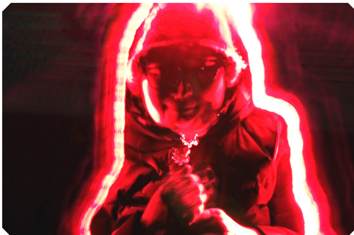
Bild 4. K-labra förverkligades genom fotografering av människor rörelse och av stadsmiljöns skiftningar. Bild: "Valaistu", Eeva-Maria Grekula.

Se närmare i projektets materialbank -> K-labra, kokeellinen taidetyöpaja