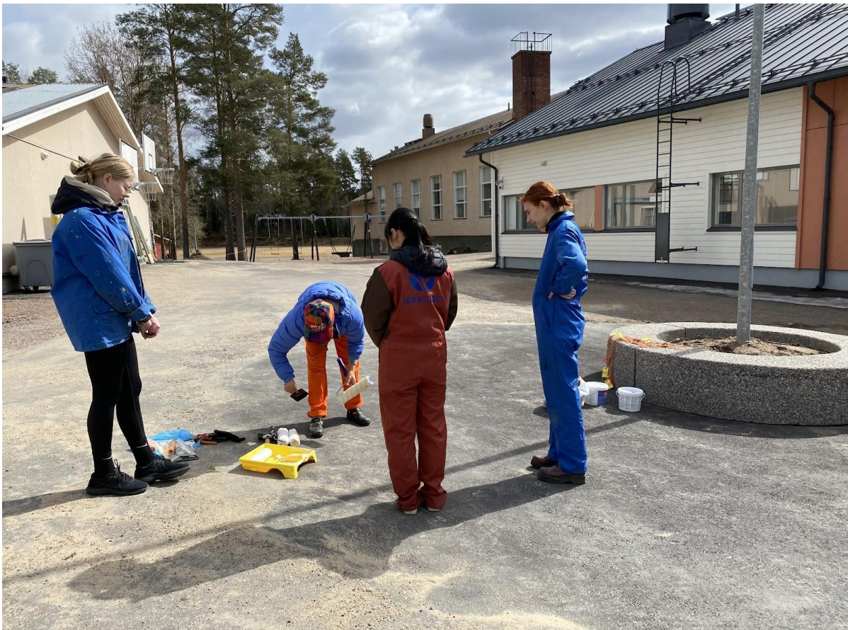
Ensikosketukset pohjamaaliin, jolla kukka alustetaan.

Perjantaina on aika suunnitella kukkaistutuksia ja maalata. Aamupäivä kuluu kukkia valitessa ja istutuksen muotoa pohtiessa. Nopeasti selviävät yhteiset mieltymykset väreihin ja malliin. Ruokailun jälkeen päästään viimein maalaamaan. Teos on suunniteltu ja enää toteutusta vailla. Kaikki odottavat innolla, että päästään oikeasti hommiin. Teoksen ääriviivat piirretään katuliiduilla asfalttiin, ja sen jälkeen onkin aika käydä töihin. Alue maalataan ensin valkoisella pohjamaalilla, jotta lopputuloksesta tulisi mahdollisimman hyvä. Ilma on viileä, eikä pureva tuuli helpota asiaa ollenkaan.