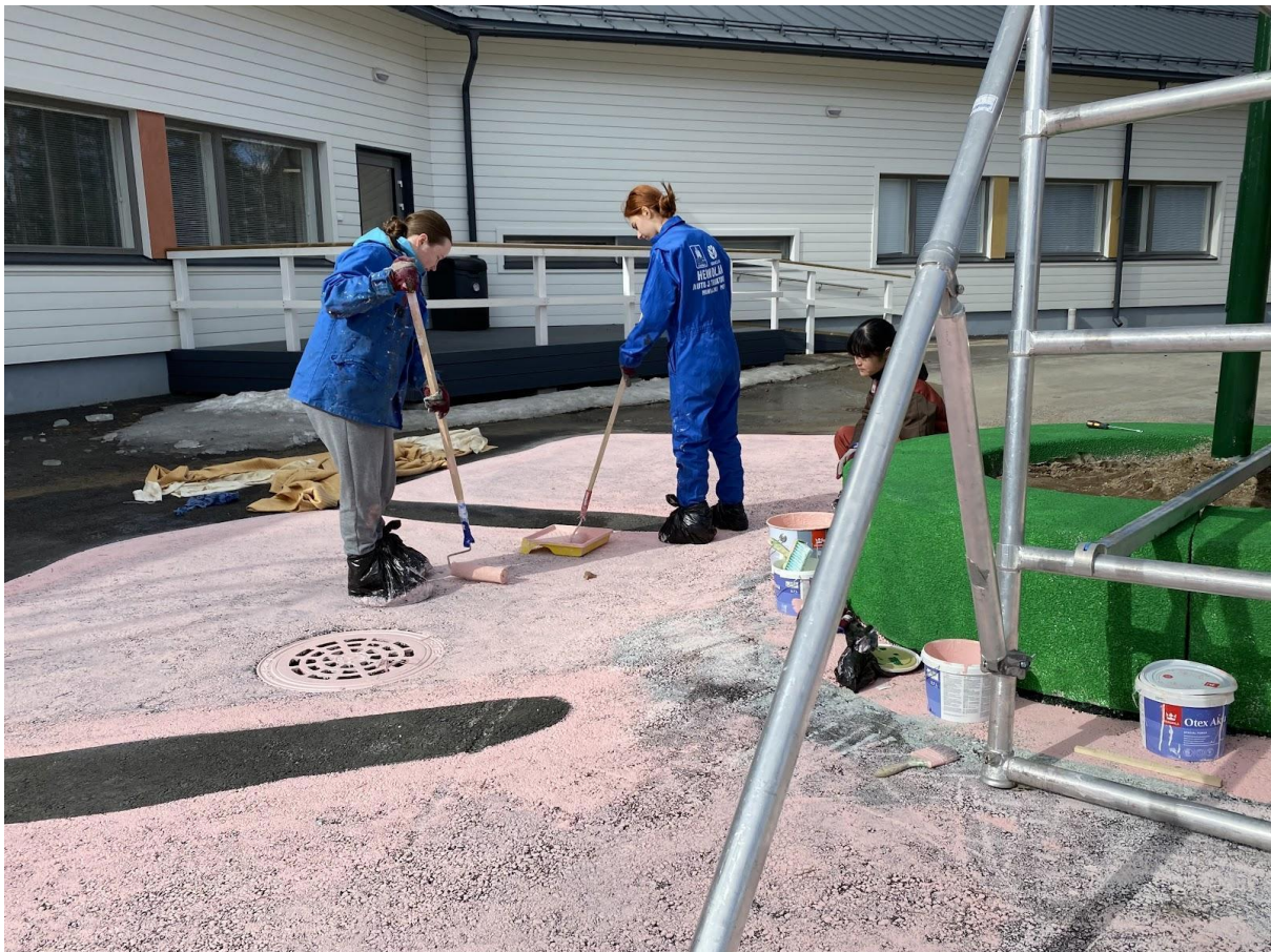
Asfaltin saadessa väriä alkaa kukka näyttämään jo todella hyvältä.

maalata. Asfaltin pesu uudelleen on pettymys, sillä se vie aikaa, jota ei ole liikaa. Lopulta viimeisetkin liat on saatu irti, ja esille voidaan ottaa maalit ja pensselit. Kirkkaan vihreä maali näyttää hienolta peittäessään tylsän harmaan sävyt. Aurinko ei ole paistanut yhtenäkkään edellisenä työskentelypäivänä, mutta tänään se hieman uskaltaa kurkistaa tumman pilviverhon takaa. Teoksen vihreän osuuden tullessa valmiiksi on aika ottaa esille vaaleanpunainen maali ja käydä kukan tekemiseen. Energiaa maalaamisen keskelle tuovat lämpimät ja herkulliset korvapuustit, joita saadaan maistaa tiimiviikon kotitalousryhmäläisiltä. Päivä päättyy hyviin tunnelmiin, vaikka pieni huoli kaihertaakin, sillä mahdollinen sade pilaisi tullessaan vastamaalattun teoksen.