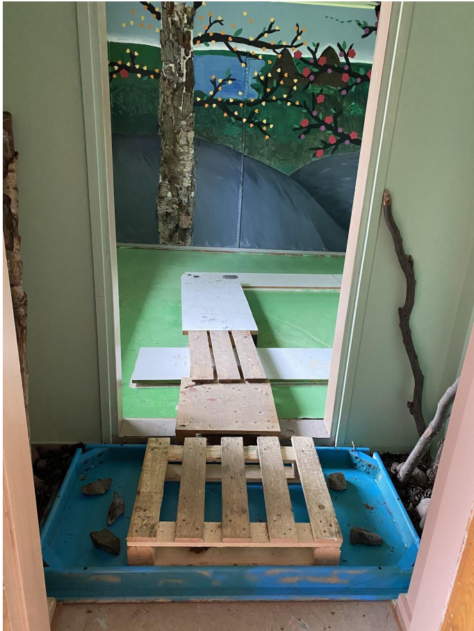
Huone viimeisteltiin pitkospuilla.