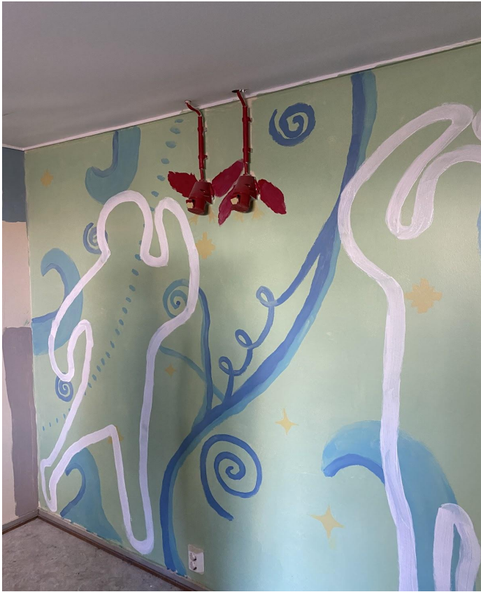
Ensimmäinen seinä valmistui vapaalla kädellä.