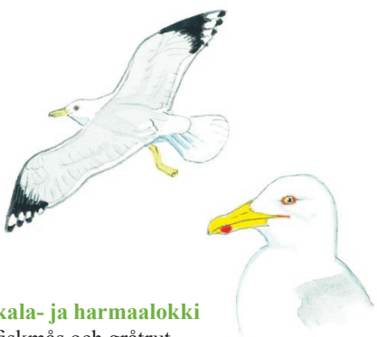
kala- ja harmaalokki fiskmåsar och gråtrut

Keväisten peltojen ensimmäisellä asuttajalla on nimensä mukaan töyhtö päälle. Helpommin hyypän tuntee kuitenkin lennossa leveistä, mustavalkoisista siivistä, ja naukuvasta, videopelimäisestä äänestä.