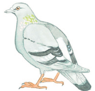
kesykyyhky eli pulu tamduva

Siroit ja keveät tiirat lentelevät väsymättömästi vesien yllä, leluttelevat paikoillaan tähyttämässä ja syöksyvät välillä alas pikkukalojen kimppuun. Kahta lajiamme, kala- ja lapintira, on melko vaikea erottaa toisistaan.