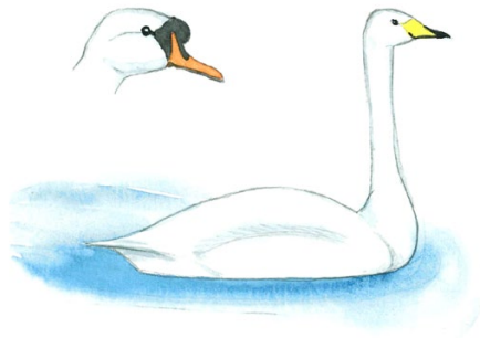
kyhmy- ja laulujoutsen knöl- och sångsvan

Upeat valkoiset linnut erottaa toisistaan ainakin nokan väristä: laulujoutsenella on keltainen, mustakärkinen nokka, kyhmyjoutsenella oranssi, mustatyvinen nokka. Laulujoutsenen voi nähdä koko maassa, kyhmyjoutsenen lähinnä merenrannoilla.