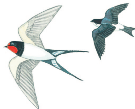
haara- ja räystäspääsky ladu- och hussvala

Tummat ja kaarevasiipiset ilmojen valtiat syövät, nukkuvat ja parittelevat ilmassa. Kirkuva srriiii -ääni kaikuu toukokuun loppula talojen seinistä ja julistaa kesän alkaneen.