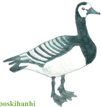
valkoposkihanhi vitkindad gås

Upeat valkoiset linnut erottaa toisistaan ainakin nokan väristä: laulujoutsenella on keltainen, mustakärkinen nokka, kyhmyjoutsenella oranssi, mustatyvinen nokka. Laulujoutsenen voi nähdä koko maassa, kyhmyjoutsenen lähinnä merenrannoilla.