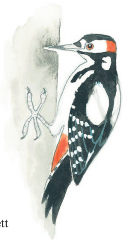
käpytikka större hackspett

Villien kalliokyyhkyjen kesyt sukulaiset viihtyvät erinomaisesti kaupungeissa, koska ruokaa on paljon ja petoja vähän, ja korkeat talot muistuttavat niiden alkuperäistä elinympäristöä, kalliiojyrkänteitä.