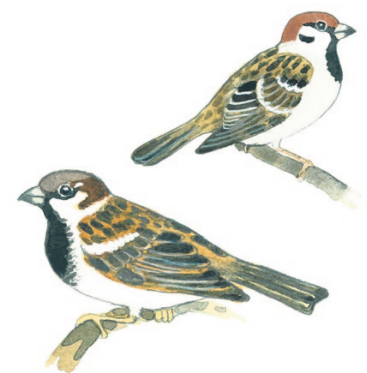
varpunen ja pikkugarpunen gråsparv och pilfink

Varsinainen jokapaikanhöylä viihtyy yhtä hyvin maalla ja kaupungissa ja kelpuuttaa ravinnoksi melkein mitä tahansa. Harmaatakki on hyvin älykäs ja osaa esimerkiksi kastaa kuivan leipäpalan veteen pehmenemään.