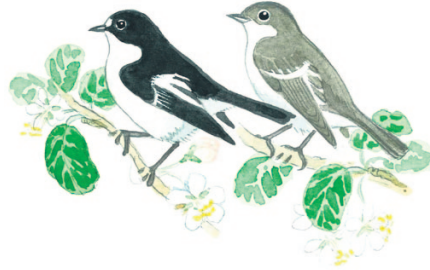
kirjosieppo svartvit flugsnappare

Räksäparvesta kuuluu jatkuvasti räkättävää juttelua. Parvi antaa hyvän suojan pesärosvoilta, joita emot jahtaavat yhteistuumin. Hyvä tuntomerkki on varsinkin lennossa näkyvä harmaa alaselkä.